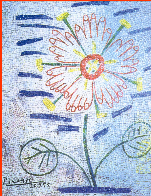
MURAL FSM DE PABLO PICASSO, 1955

Congreso Internacional de Sindicatos de Trabajadores de la Energía