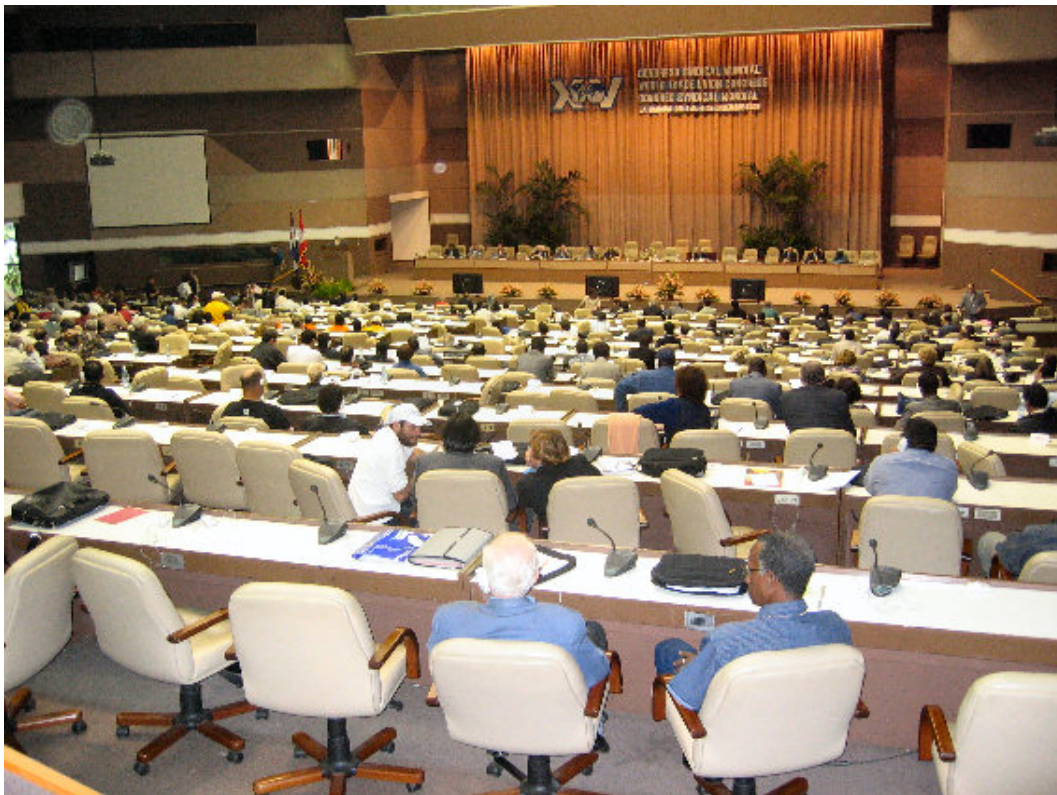
XV Congreso Sindical Mundial, La Habana, Cuba, 2005

Con estas bases, y teniendo en cuenta valiosas experiencias previas en la FSM se presenta a la consideración del Congreso Internacional de Sindicatos de Trabajadores de la Energía (UIS-Energía) las siguientes propuestas.