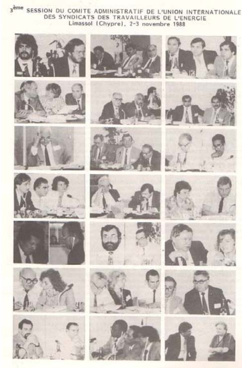
Reunión y marcha de la exUISTE en Limassol, Chipre, 1988. Derecha: Boletín de la UISTE, Izquierda: Comité administrativo de la UISTE.