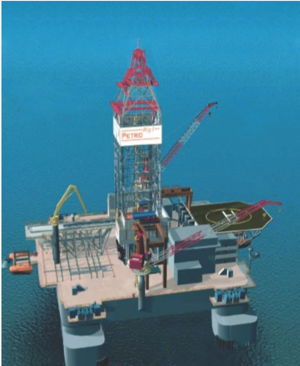
Plataforma marina de PetroMena, transnacional noruega que participa ilegalmente de contratos con Pemex para la perforación en el Golfo de México

En suma, existe un severo proceso de desintegración industrial y privatización de la industria petrolera de México.