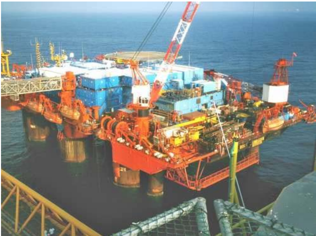
Plataforma marina de Swecomex, del grupo Carso, que participa ilegalmente en la extracción de petróleo crudo y gas natural en Ku-Malooop-Zaap, Golfo de México

Peor aún, para operar su propio Sistema Nacional de Ductos (SND), Pemex necesita de un permiso privado de la CRE. Esta le da a Pemex el trato de empresa privada y, además, la obliga a prestar el servicio del SND a los demás permissionarios privados. A la Comisión Federal de Electricidad (CFE) también se le otorgan permisos privados para transportar el gas que abastece a las centrales privadas de generación e, incluso, a sus propias plantas.