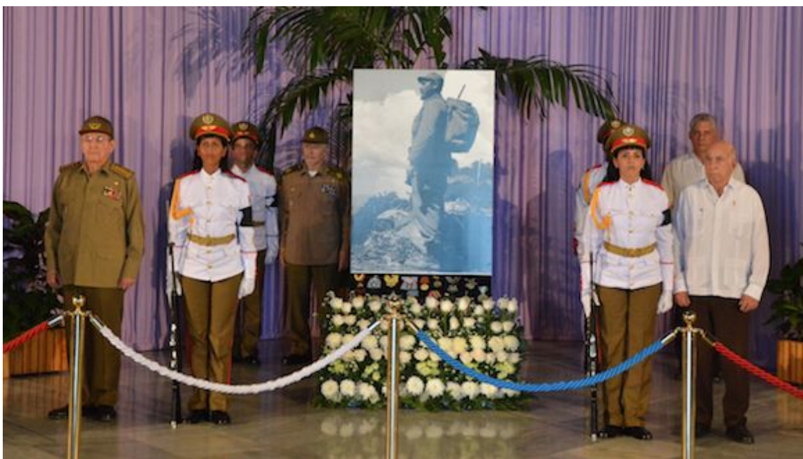
Ultima guardia en el memorial Martí.