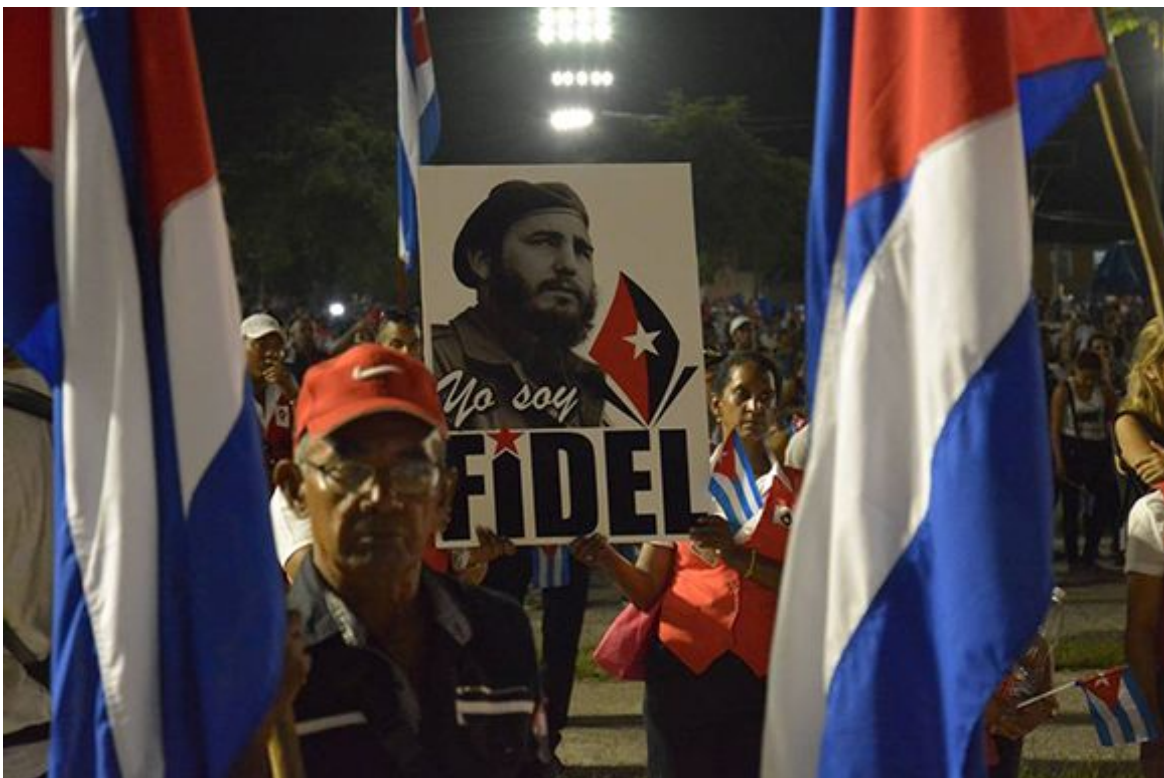
"Yo soy Fidel", coreo la multitud en La Habana.

Frente de Trabajadores de la Energía, de México