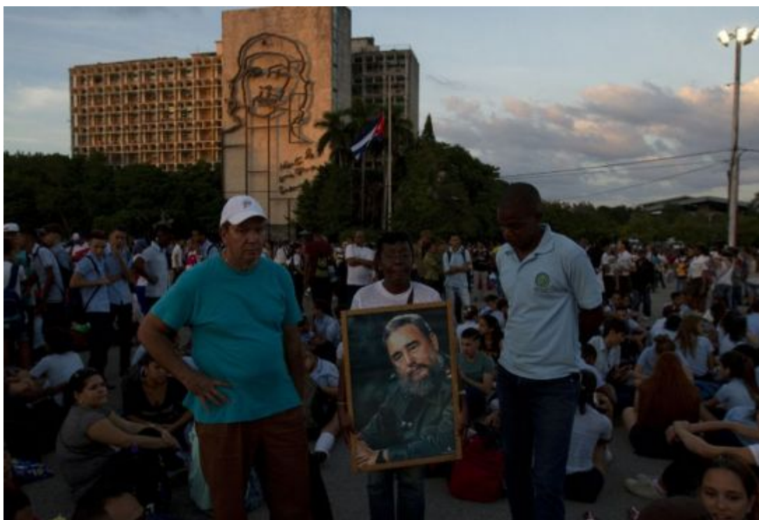
El pueblo cubano en la Plaza de la Revolución.