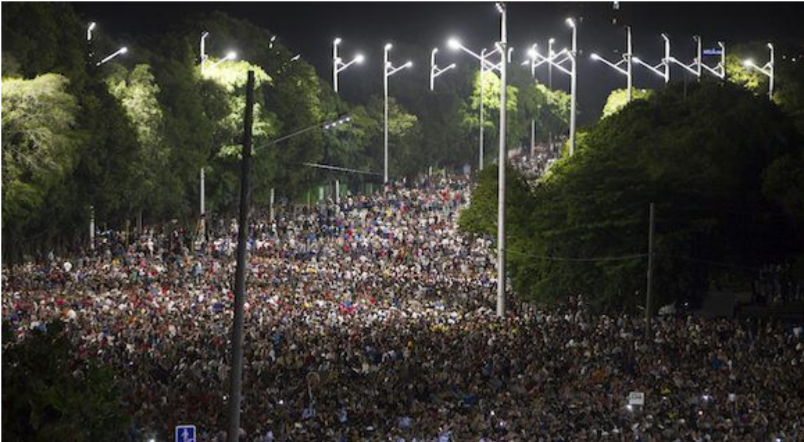
La multitud rindió honores a Fidel en La Habana.