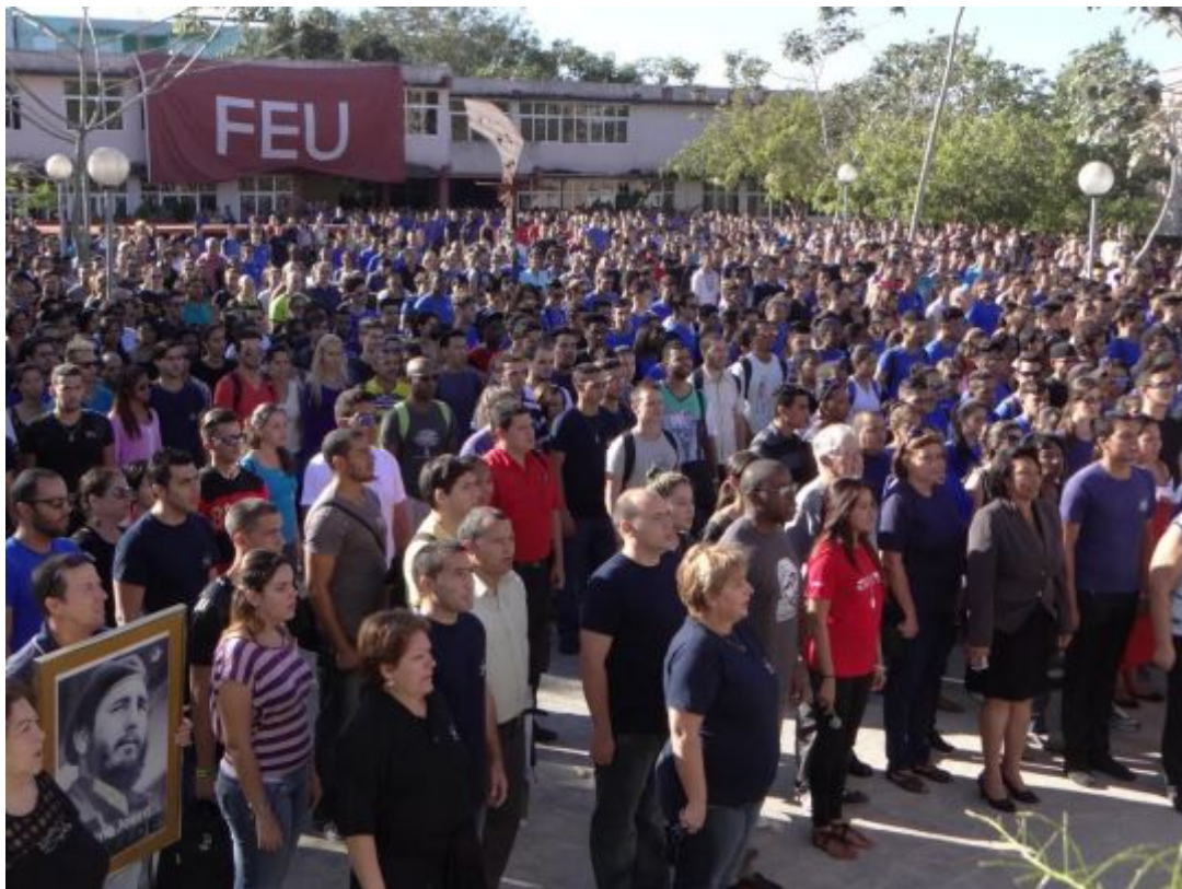
Los estudiantes homenajearon a Fidel.