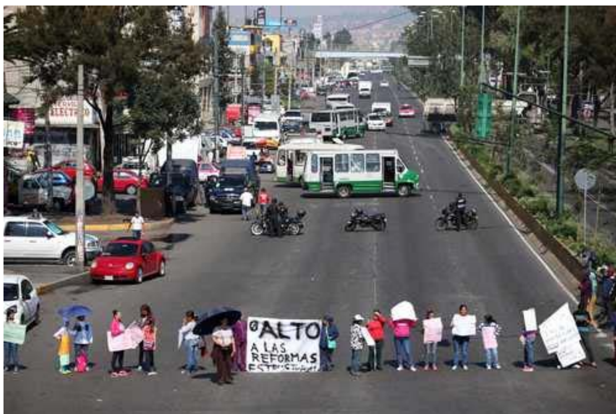
Ermita-Iztapalapa, cdMx, 8 julio 2016.

Lo dicho, Peña aceptaría solo el maquillaje a su reforma. En eso consiste la maniobra, en simular que todo cambia para seguir igual. Evidentemente, no es lo mismo derogar que "revisar".