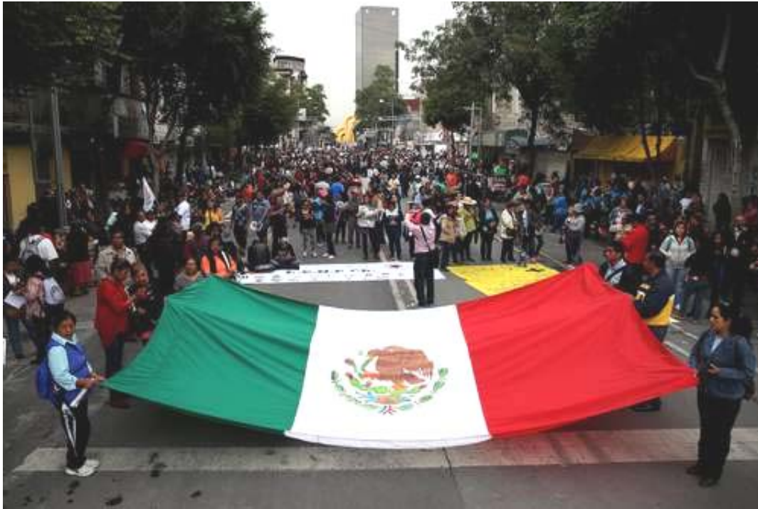
Marcha magisterial, cdMx, 11 julio 2016.