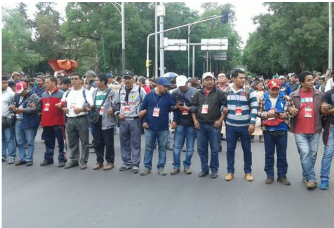
Maestros en marcha, cdMx, 11 julio 2016.

Frente de Trabajadores de la Energía, de México