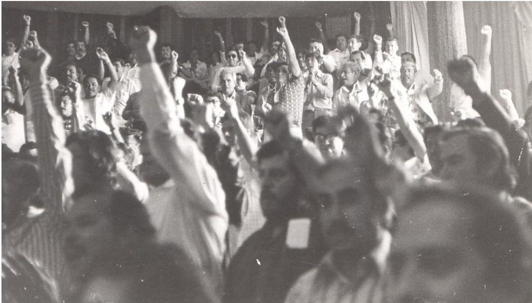
¡Huelga! Asamblea en el Centro Nuclear de Salazar, 12 julio 1976.