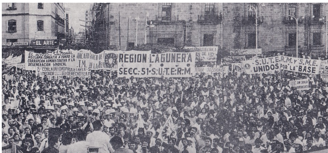
Marcha-mitin de la Tendencia Democrática, Guadalajara, 5 abril 1975.