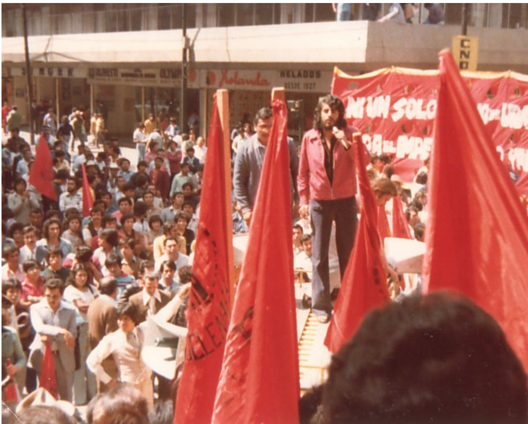
¡No, a la privatización del Uranio!, mitin, Cámara de Diputados, 1978.

Frente de Trabajadores de la Energía, de México