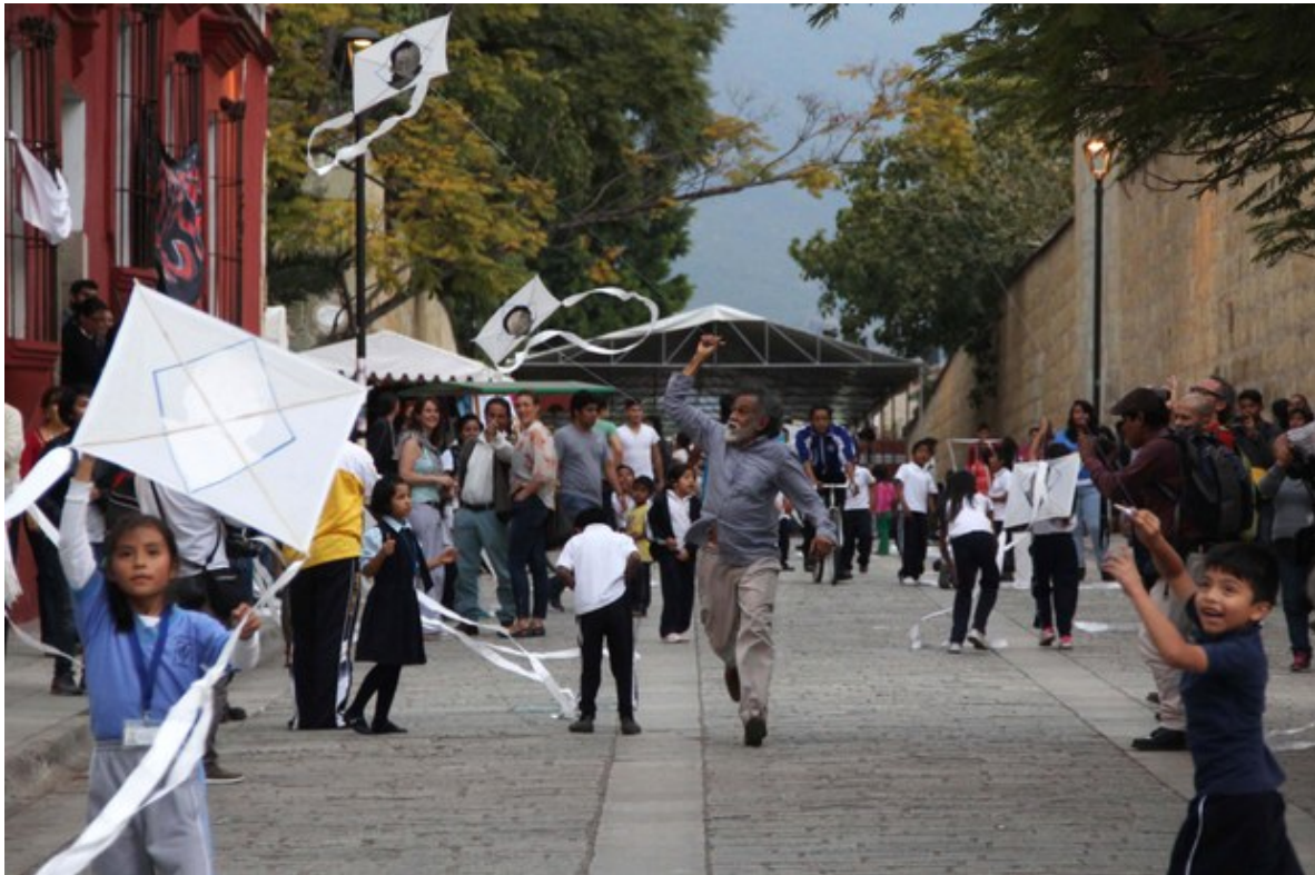
Toledo, niños y población volando los papalotes en Oaxaca.

Frente de Trabajadores de la Energía, de México