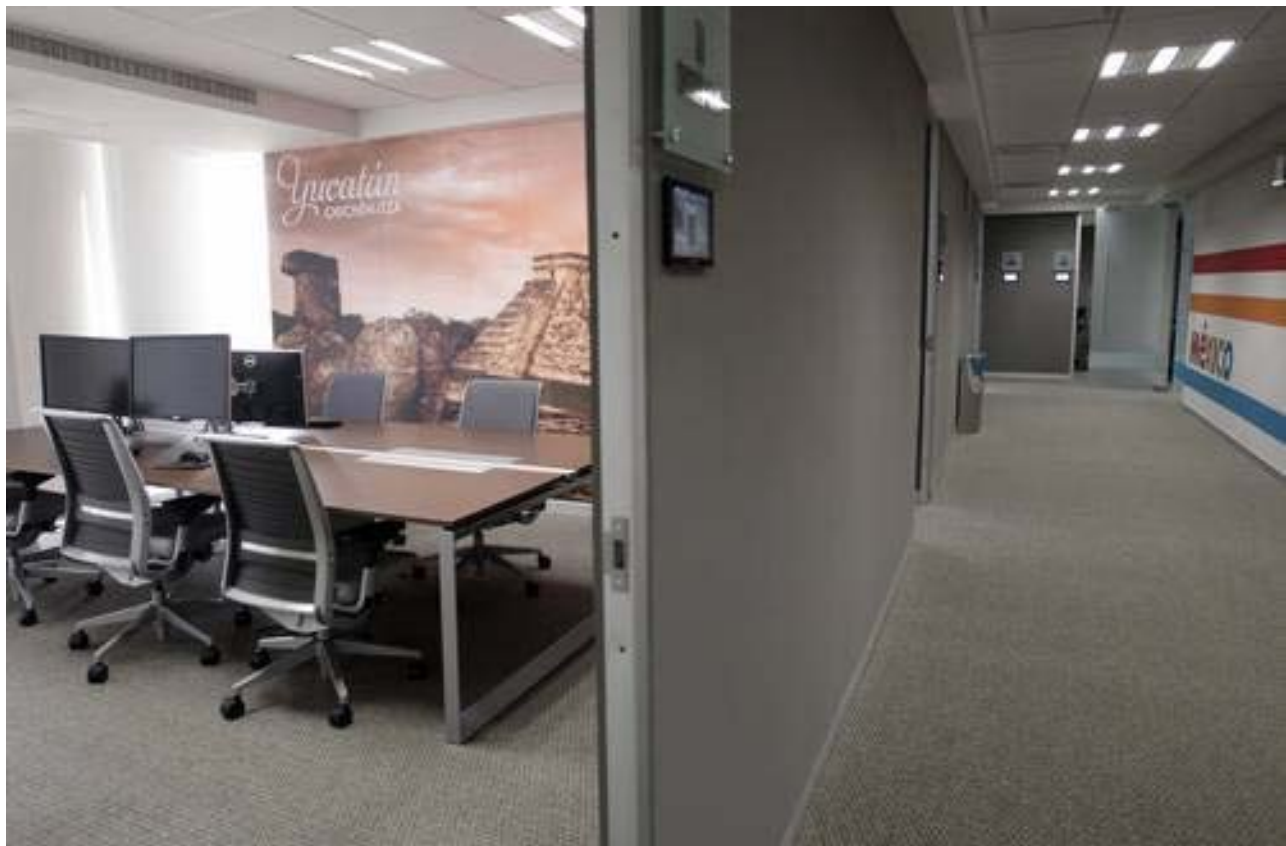
Cuarto de datos de la Comisión Nacional de Hidrocarburos.