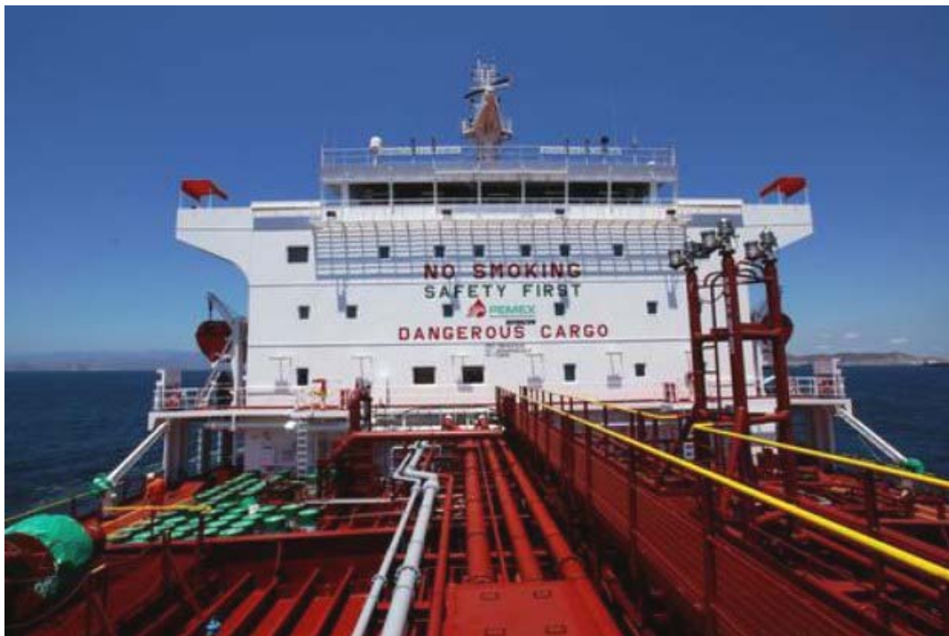
Buque tanque de Pemex. Seguir exportando petróleo crudo es lesivo para la nación, el crudo debe procesarse en el país

Frente de Trabajadores de la Energía, de México