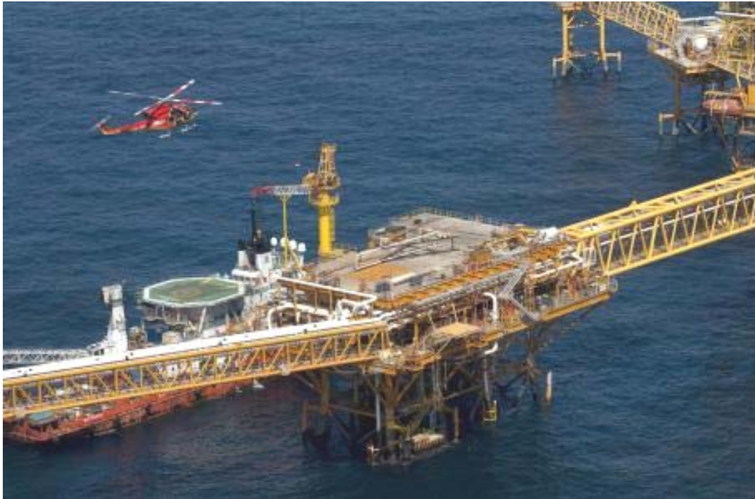
Plataforma petrolera en el Golfo de México.