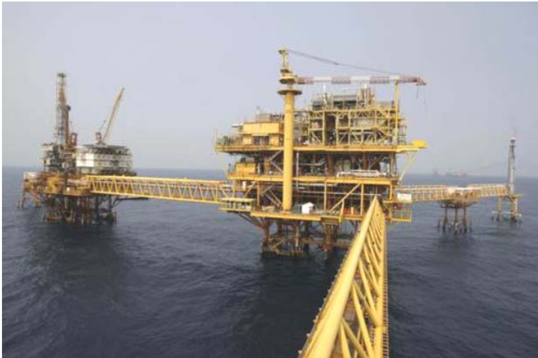
Plataforma Ku-S, de KU-Malooob-Zaap, en la Sonda de Campeche.

La caída del día cerró en 1.3376 el galón cerca del nivel del 10 de marzo de 2009.