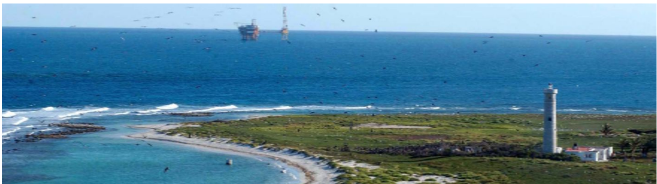
El petróleo es un recurso natural no renovable y finito, quemarlo es criminal

A continuación se describe y comenta la iniciativa de Ley.