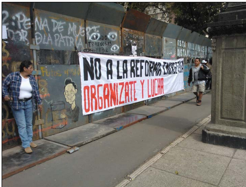
Manta universitaria contra la reforma energética sobre las vallas policíacas en el Senado