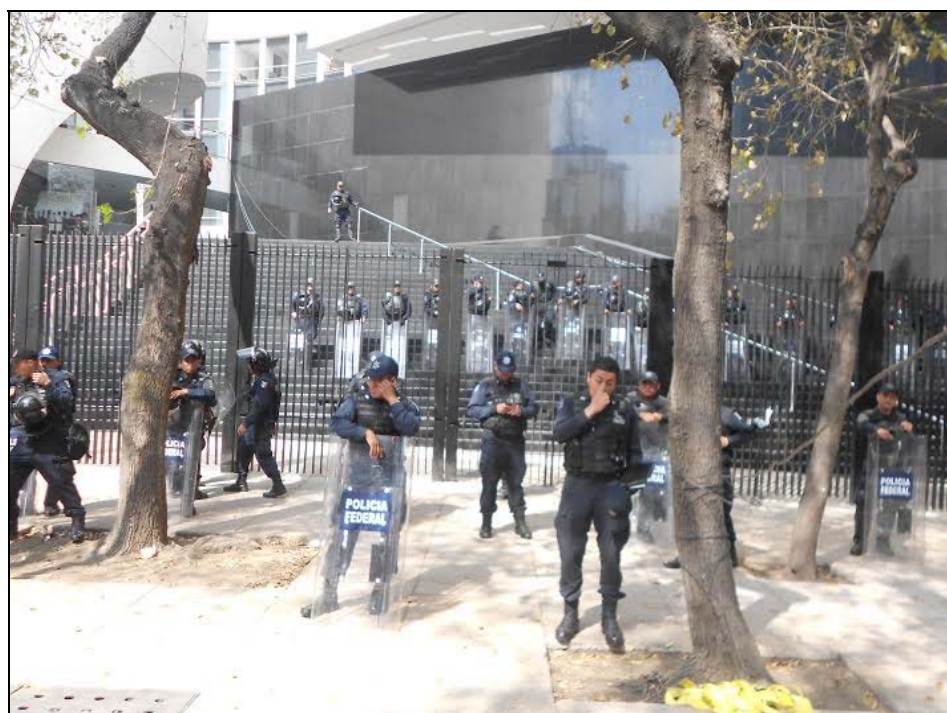
Mitin universitario contra la reforma energética en medio del cerco policiaco en el Senado

Frente de Trabajadores de la Energía, de México