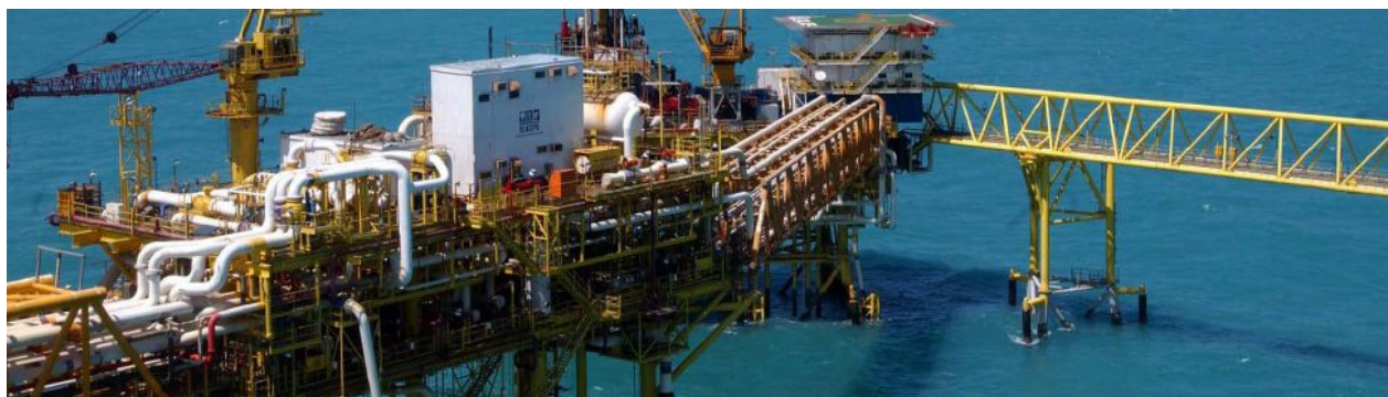
La discusión no es con los diputados ni senadores, eso carece de sentido, los grandes problemas nacionales NUNCA se han resuelto en las Cámaras sino en las calles. El problema es político y de relación de fuerzas.

¡No, dirá Bernal, no es cierto! ¡Sí, le contestamos, es cierto, está probado y comprobado! Los cabilderos de las transnacionales ya están muy activos. Contarán voto por voto, diputado por diputado. A ninguno le molestará, al contrario, ya están listos para oprimir el botón de la votación electrónica. En un solo movimiento traicionarán a la nación pero su cuenta bancaria personal será abultada ipso facto. Bernal estará entre los primeros que no resistirán el cañonazo de a 50 mil dólares.