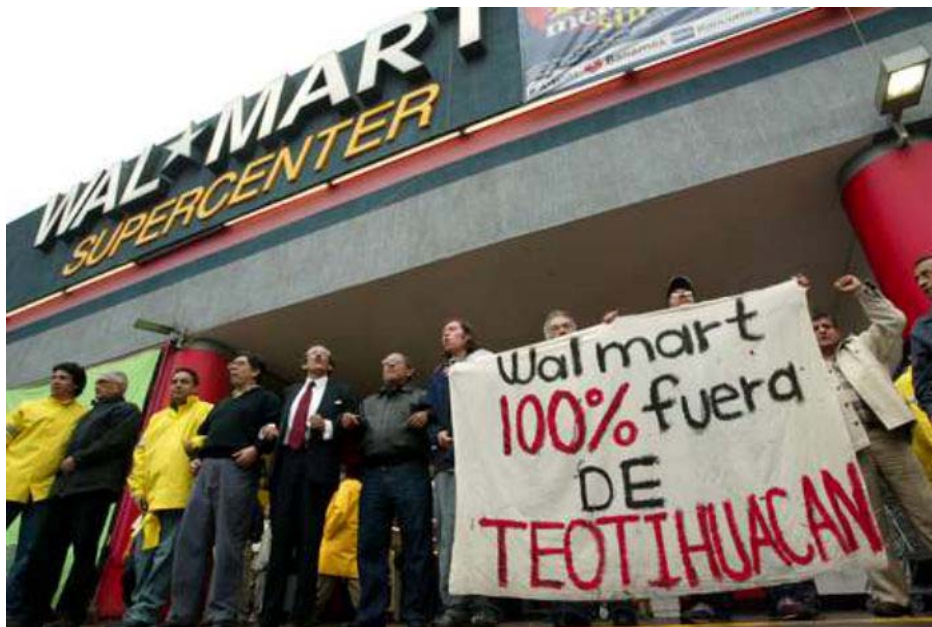
Protesta contra Walt-Mart en Teotihuacan

Frente de Trabajadores de la Energía, de México