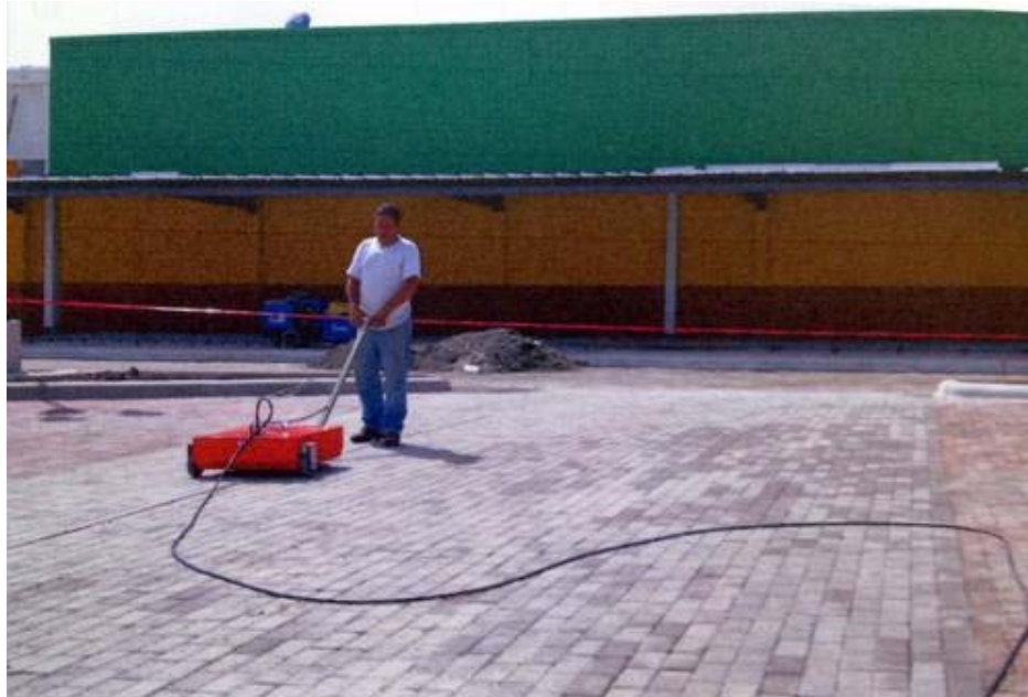
Estudios con georadar después de la construcción de Wal-Mart en Teotihuacan

responsables, porque los hay, deben ser sancionados. ¡Fuera Wal-Mart de Teotihuacan!