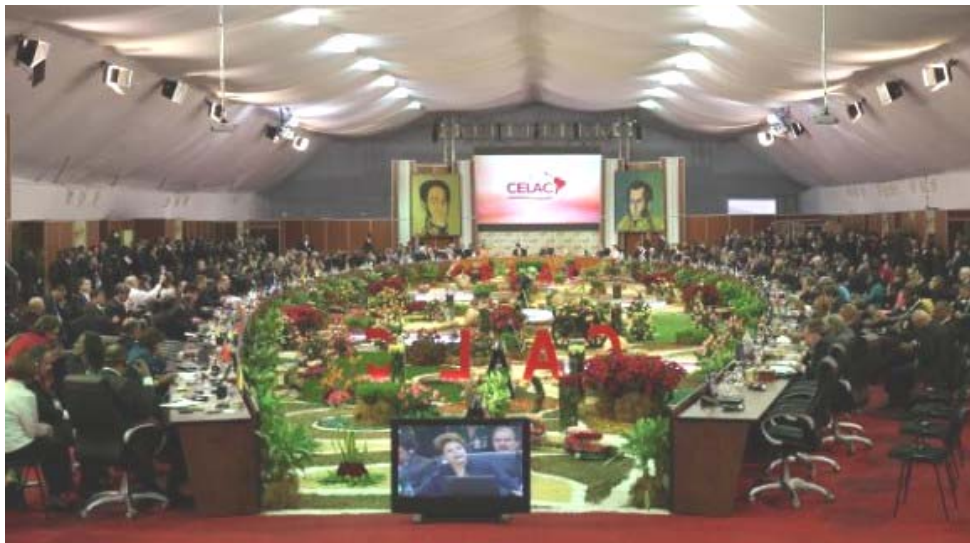
Cumbre de la CELAC en Caracas, Venezuela, 2-3 de diciembre de 2011