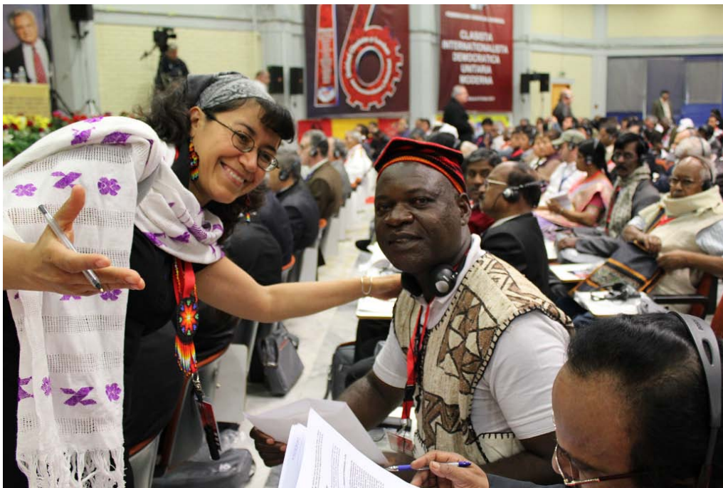
Distribución personal de las propuestas del FTE de México

2011, elektron 11 (120) 8, FTE de México