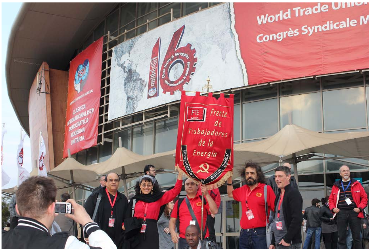
Delegación del FTE de México en el 16° Congreso Sindical Mundial