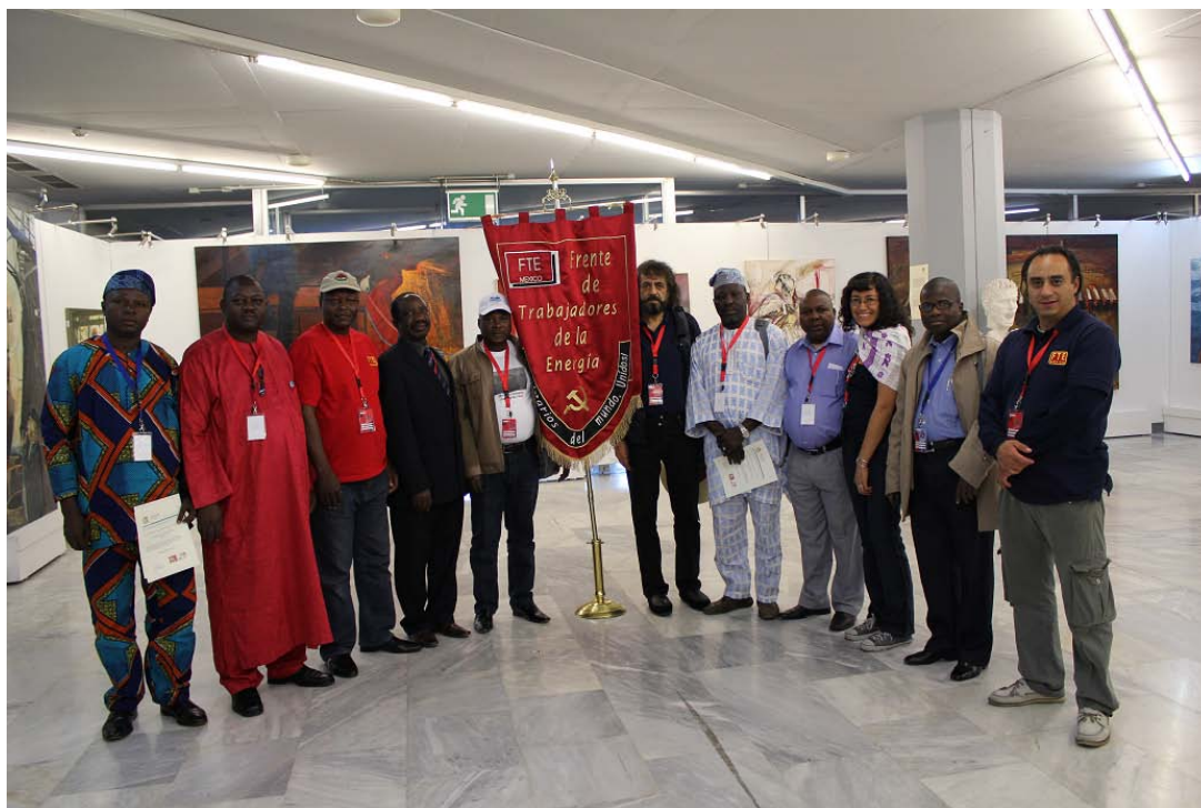
Delegaciones de México y de Nigeria