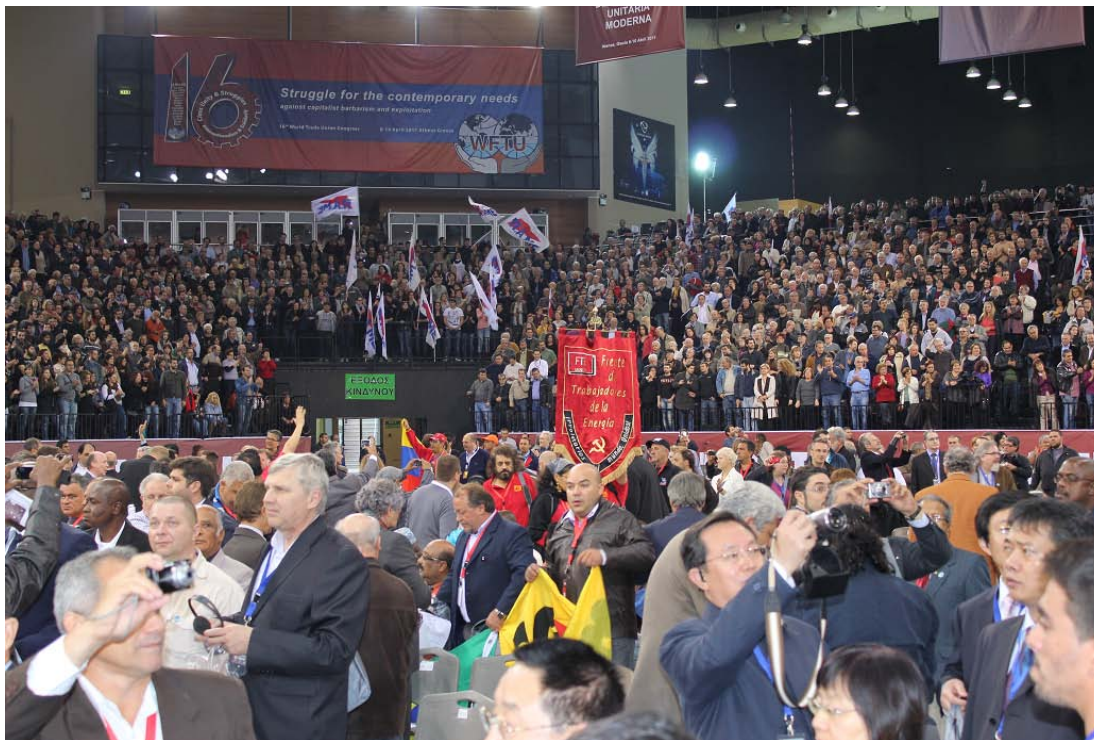
Inauguración del 16º Congreso Sindical Mundial