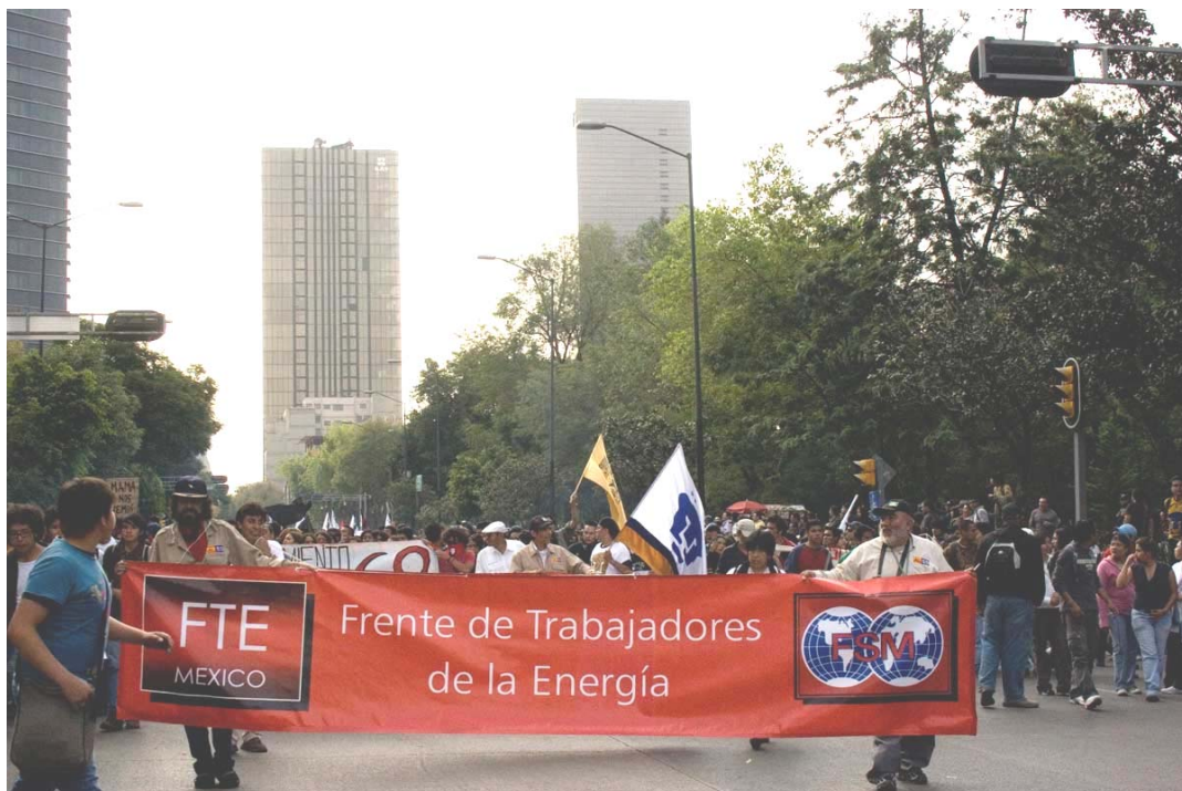
Frente de Trabajadores de la Energía, de México