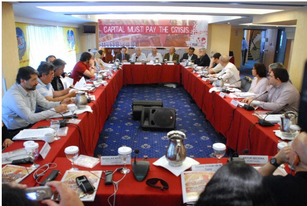
Delegados a la Conferencia de sindicalistas metalúrgicos en Atenas