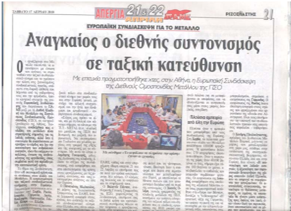
Información periodística sobre la Conferencia metalúrgica en Atenas