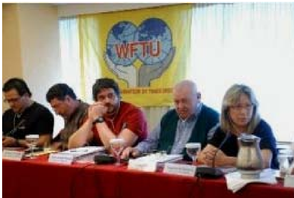
Participantes en la Conferencia Europea de la UIS del Metal