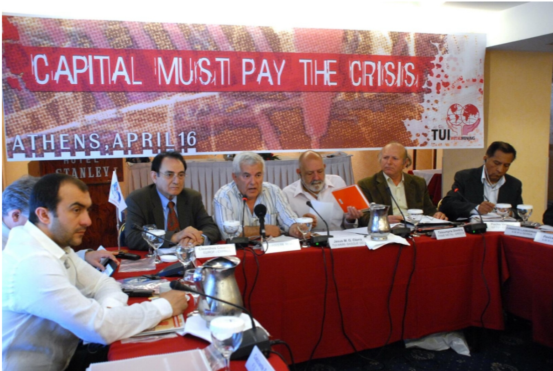
Conferencia Sindical Europea de la UIS del Metal