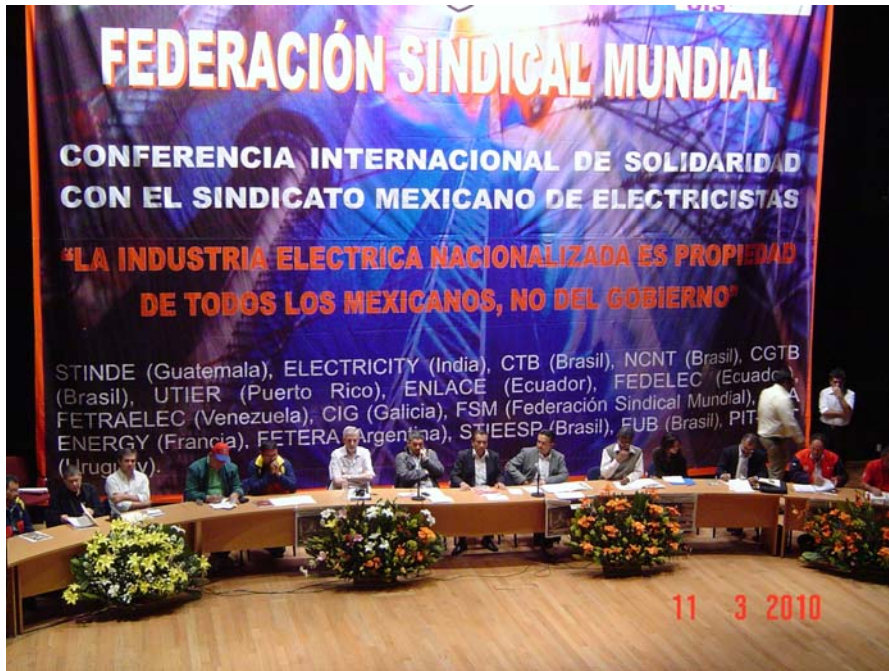
Delegaciones en la Conferencia Internacional