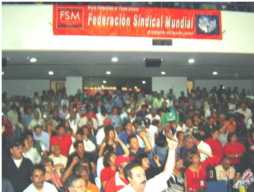
Electricistas del SME en la Conferencia Internacional

Frente de Trabajadores de la Energía, de México