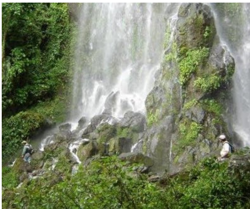
Cascada propiedad de LINEAR GOLD