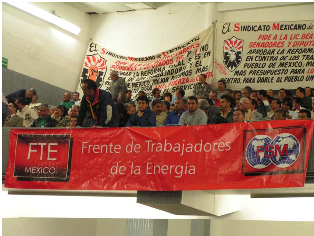
Presencia de trabajadores en el Congreso Internacional de la UISTE