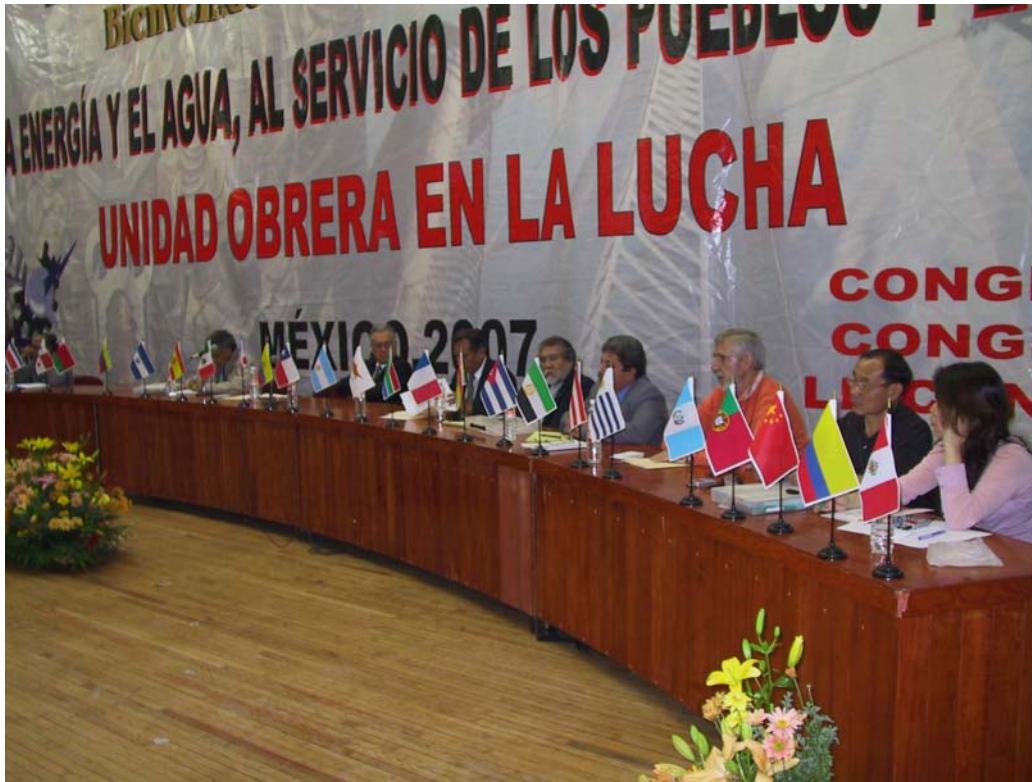
Presidium del Congreso Internacional de Sindicatos de Trabajadores de la Energía