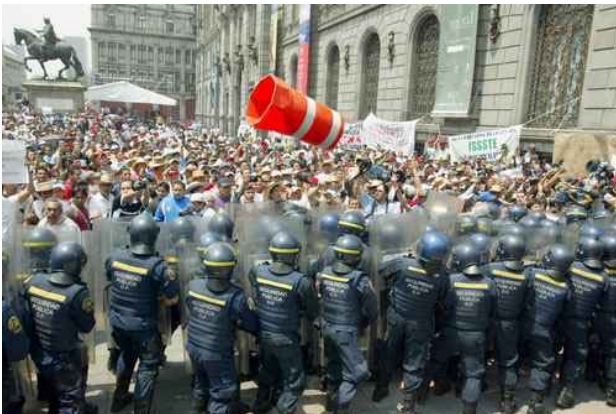
Protesta de maestros en el Centro Histórico de la Ciudad de México

La jornada se ha sostenido fundamentalmente por los maestros de la CNTE y algunas organizaciones más. La UNT, sindicatos universitarios y otrora combativos gremios no han pasado de declaraciones “banqueteras”, improvisadas y sin ningún compromiso.