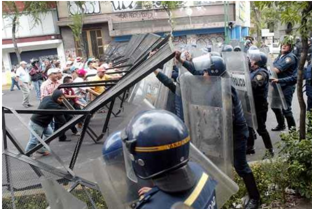
Mitin de maestros frente a la secretaría de gobernación

La realización del Congreso fue un evento importante en una coyuntura especial. No obstante, el análisis parece haberse quedado en torno a las acciones inmediatas. Sigue haciendo falta una propuesta programática y organizativa de mayor alcance.