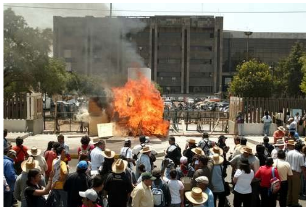
Mitin de la sección 22 de Oaxaca frente a la Cámara de Diputados

El éxito del paro del 2 de mayo fue indiscutible, representa un triunfo de la CNTE y organizaciones participantes. Representa también una limitación porque la acción gravitó en las fuerzas de los propios maestros, otras organizaciones especializadas en hacer declaraciones se quedaron mirando.