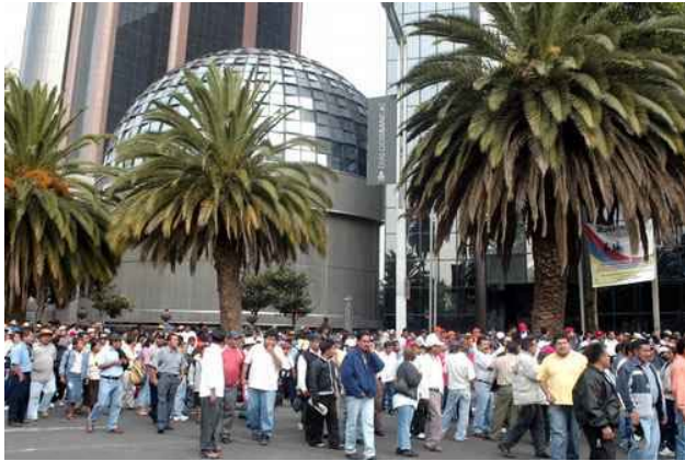
Protesta de maestros ante la Bolsa Mexicana de Valores