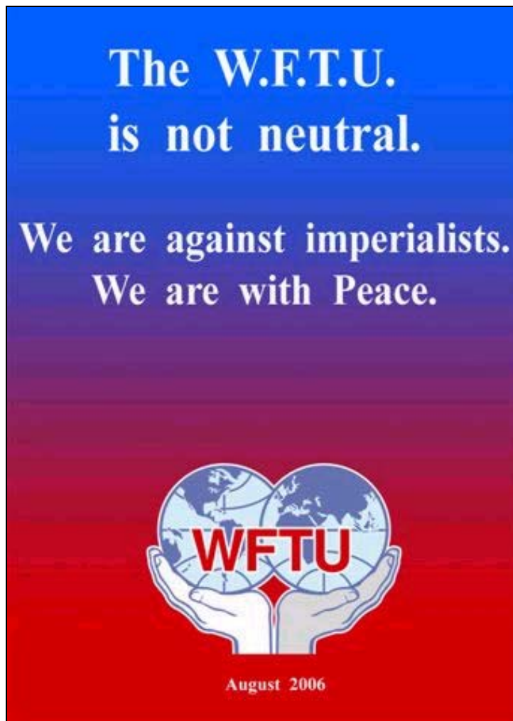
Cartel solidario de la Federación Sindical Mundial. La F.S.M. no es neutral. Estamos contra el imperialismo. Estamos con la paz. Cartel y FOTO : wftucentral.org