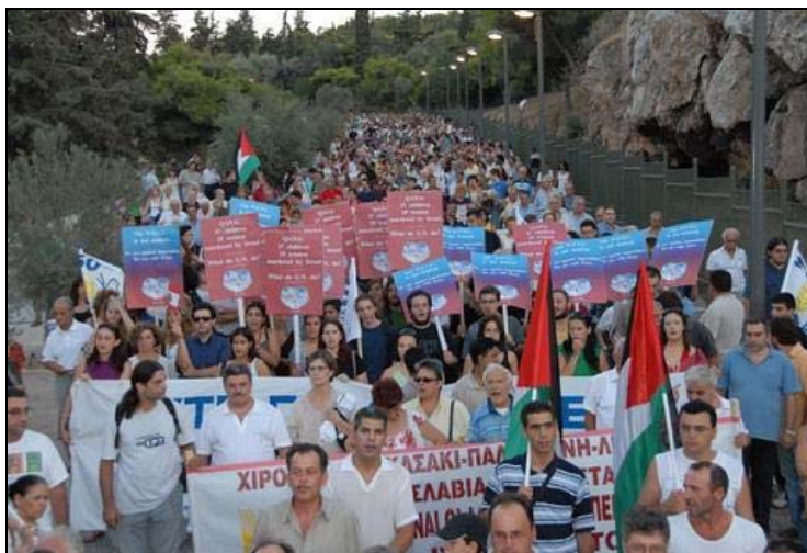
Marcha en Atenas, Grecia, en solidaridad con Líbano y Palestina