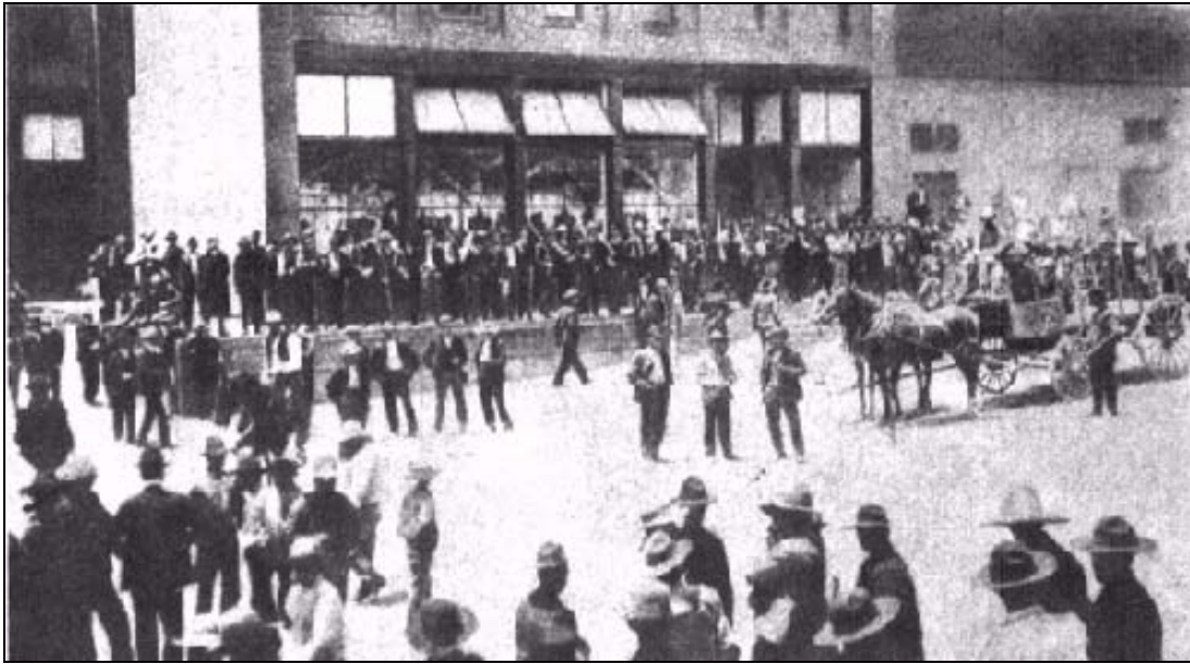
Norteamericanos armados protegiendo la tienda de raya.