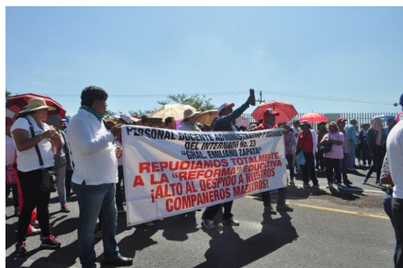
Cuernavaca, 7 julio 2016.