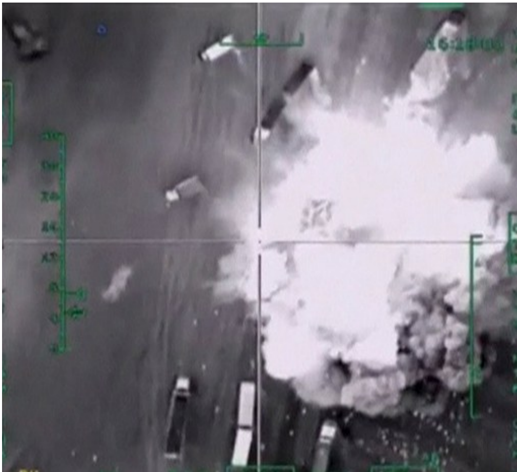
Bombardeos rusos en Siria, 4 dic 2015.