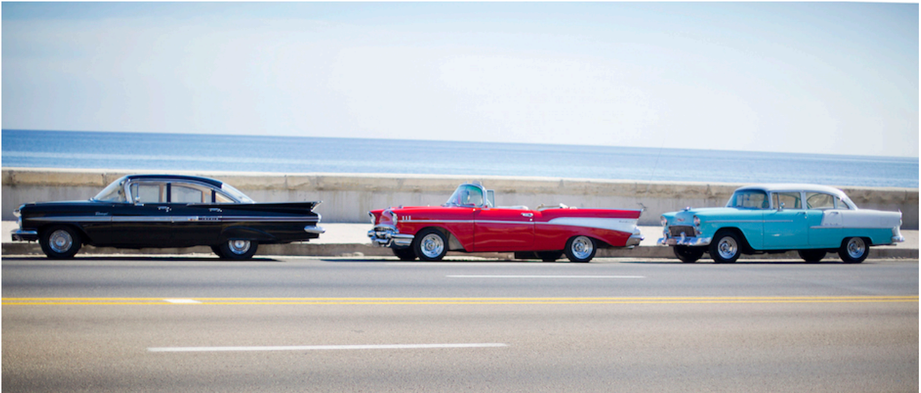
Antiguos chevroleets en el malecón de la Habana, frente a la embajada norteamericana.