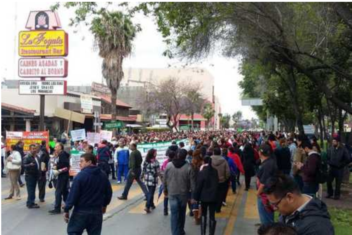
Marcha magisterial en Mexicali, Baja California.