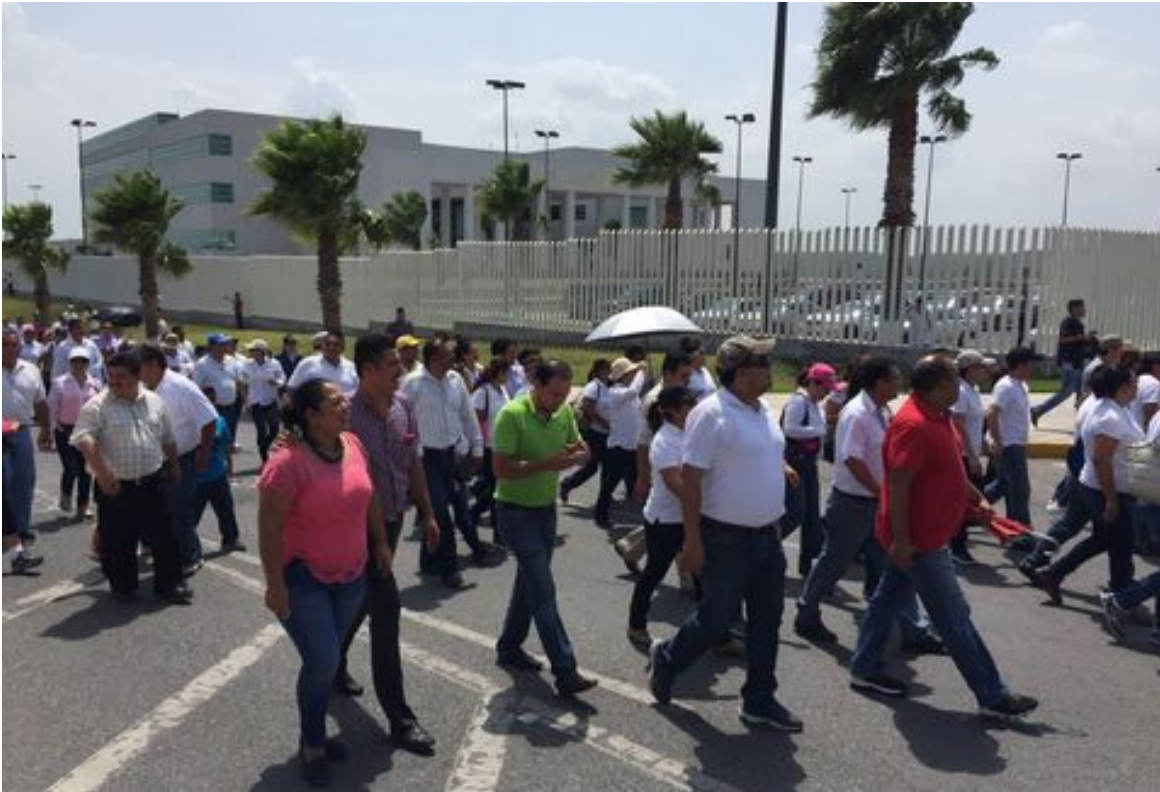
Marcha magisterial en Ciudad Victoria, Tamaulipas.

2015, energía 15 (315) 40, FTE de México