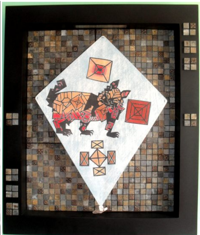
Francisco Toledo. “Papalote Gato Cantonés No. 1”, 69 x 54.5 cm, técnica mixta, papel hecho a mano con fibras naturales y estructura de carrizo entrecruzado. Cola del papalote también de papel hecho a mano y cordel de unión en color negro. Imágenes grabadas y pintadas a mano. Figura: un Gato o felino formado con figuras triangulares y cuadradas. Fondo del Papalote en color azul claro. Color del gato en negro, rojo, café y café claro. Alegorías de cuadros alrededor en tonos color café.