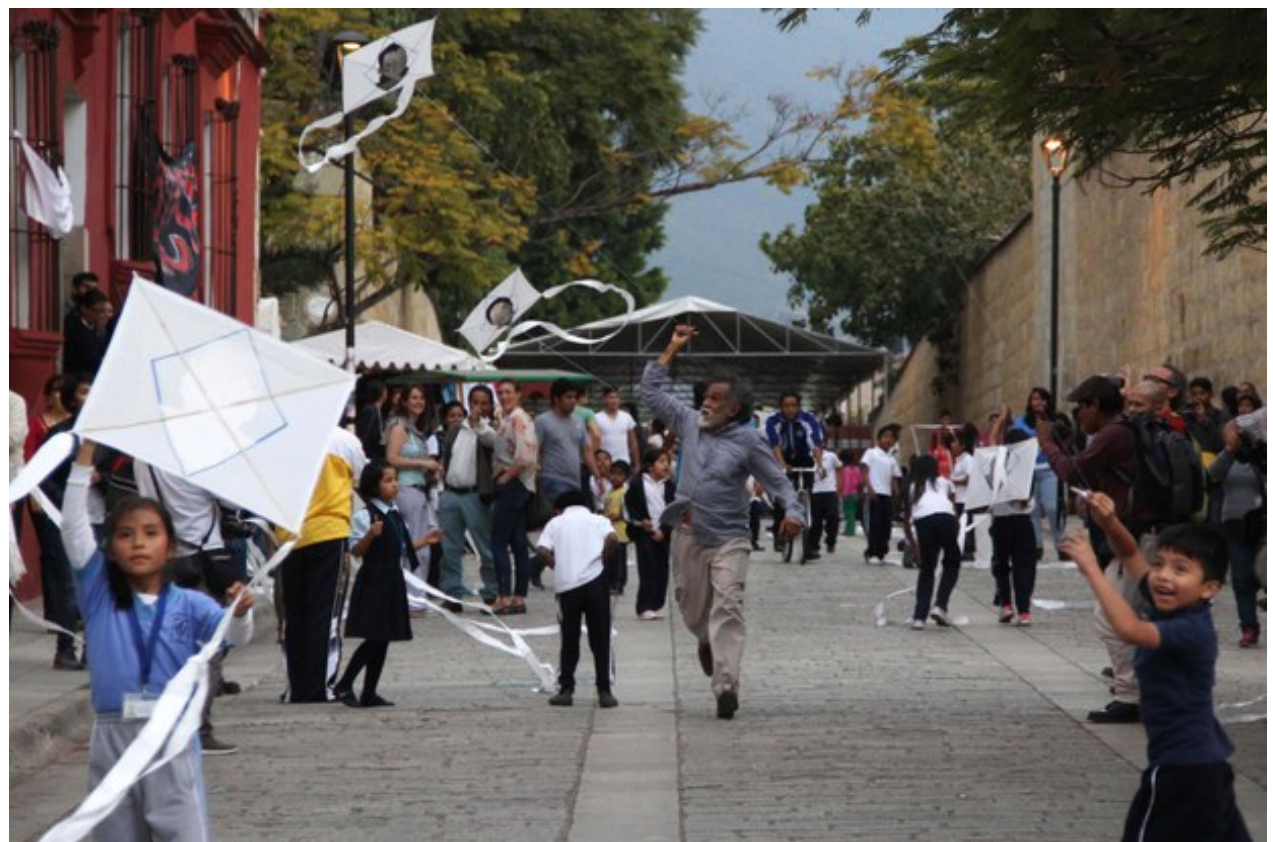
Toledo, niños y población volando los papalotes en Oaxaca.