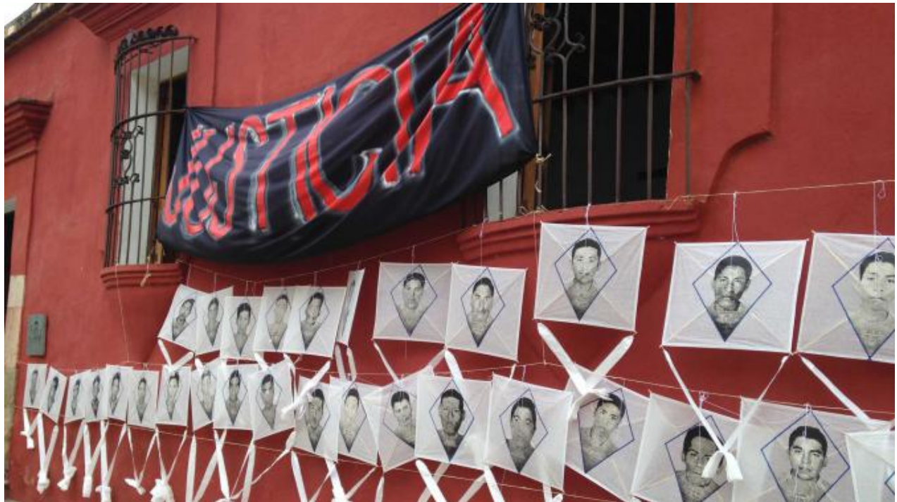
Los 43 papalotes sobre los estudiantes desaparecidos, de Toledo.