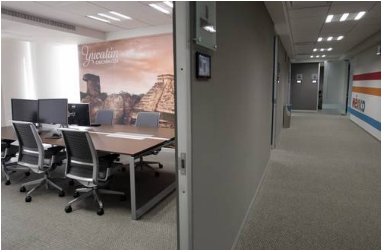
Cuarto de datos de la Comisión Nacional de Hidrocarburos.

Ref: 2015, elektron 15 (78)1-8, 18 marzo 2015, FTE de México.