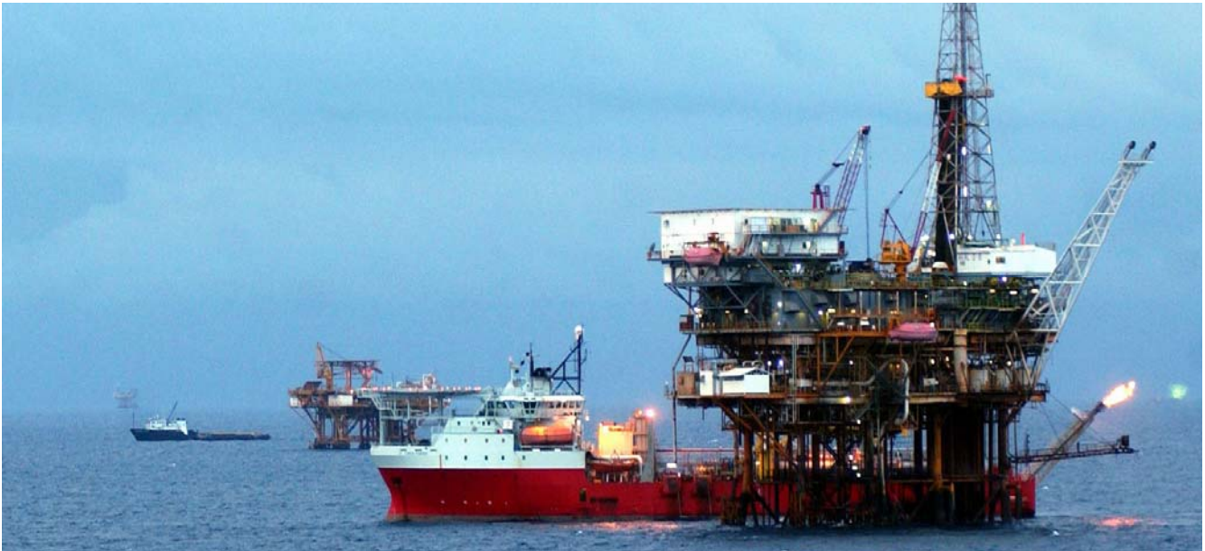
Las transnacionales extraerán mucho petróleo. ¿Pagarán impuestos? ¿Y, la depredación ambiental?

El costo de extracción de un barril de petróleo le cuesta a Pemex 6.9 dólares, inferior al de las demás petroleras del mundo. Según El Universal, la tasa de retorno es de 64%. Eso hace de alta rentabilidad a la petrolera mexicana, colocada en tercer lugar después de E&P de Indonesia y EBN de Holanda. Tan importante patrimonio fue desnacionalizado por el gobierno de Peña Nieto. Falta por definir cuántos impuestos pagarán las corporaciones transnacionales encargadas de la exploración y extracción de hidrocarburos.