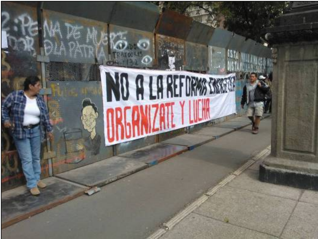
Manta universitaria contra la reforma energética sobre las vallas policíacas en el Senado