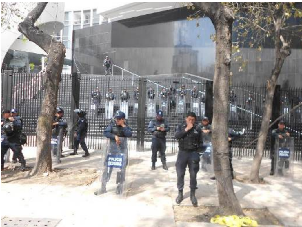
Mitin universitario contra la reforma energética en medio del cerco policiaco en el Senado