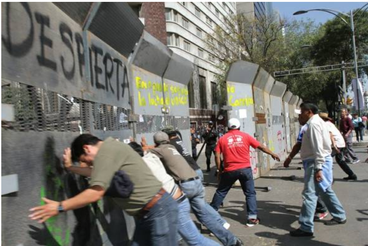
Maestros intentando remover vallas policiacas en el Senado