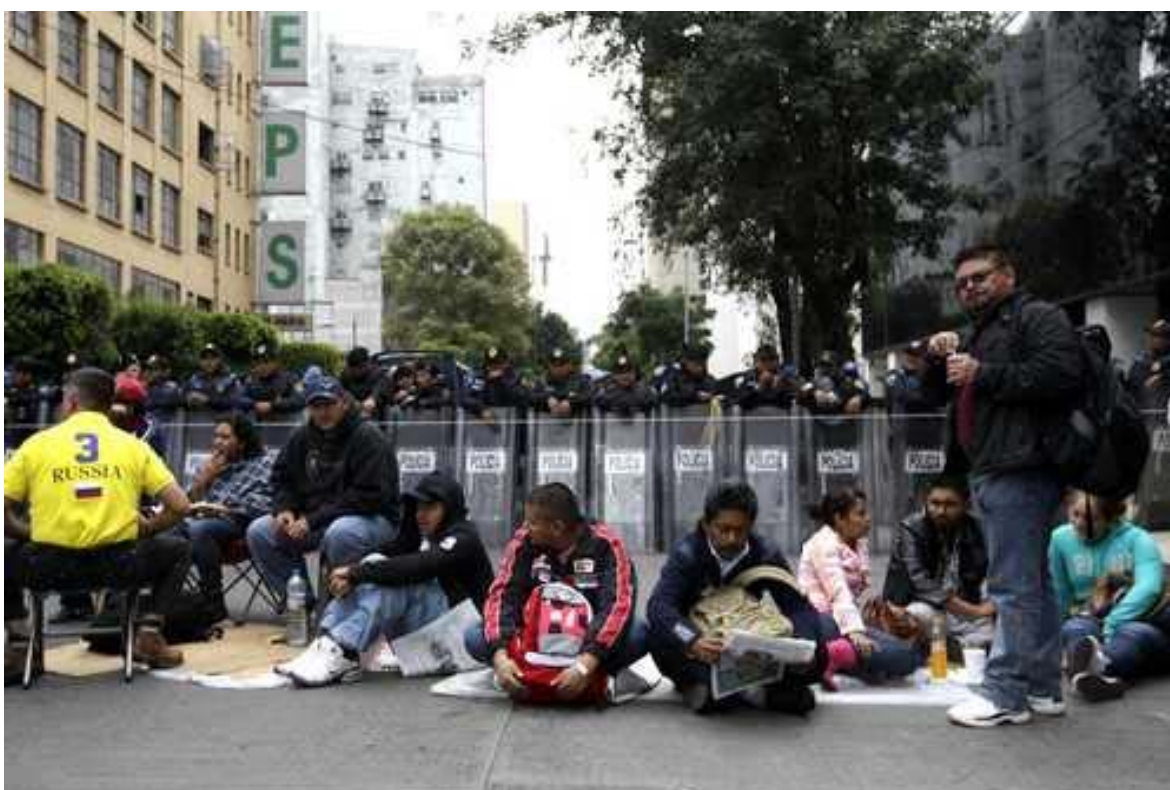
Maestros en el cerco al Senado contra la reforma energética