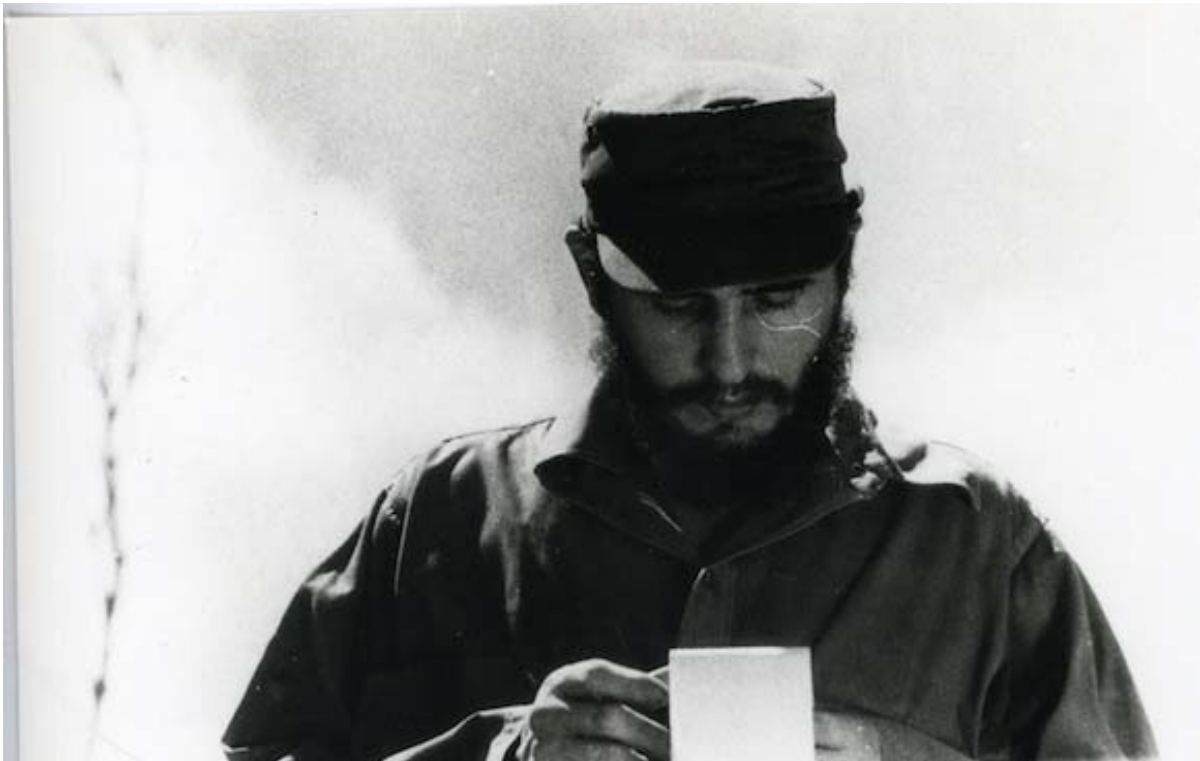
Fidel Castro en La Habana, enero de 1959