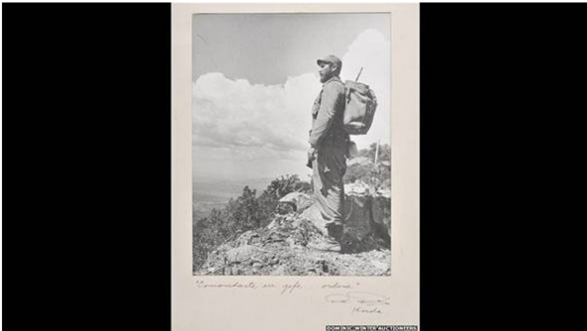
Fidel en las montañas

Ref: 2013, elektron 13 (146) 1-6, 14 agosto 2013, FTE de México.