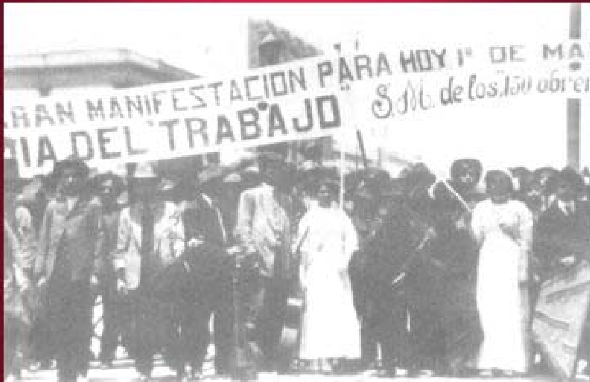
Mainifestación del 1º de mayo de 1913 en la ciudad de México

frente de trabajadores de la energía federación sindical mundial