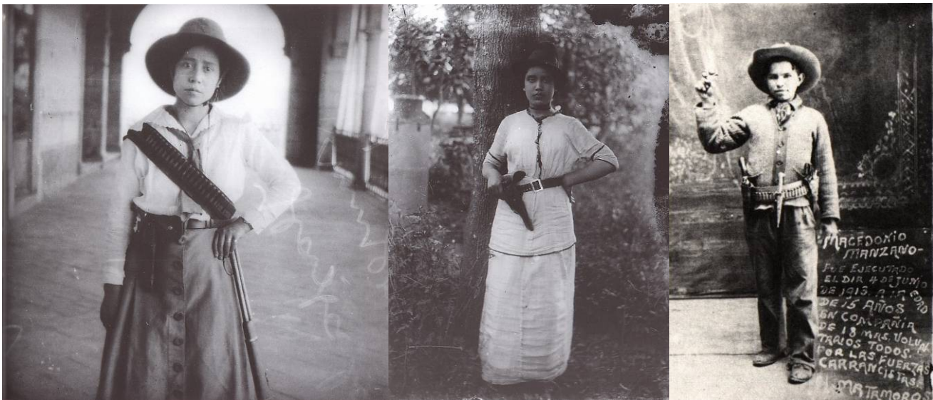
Jóvenes, niñas y niños participaron en la Revolución Mexicana