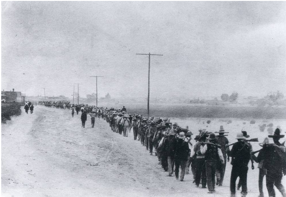
Tropas de Villa en Columbus