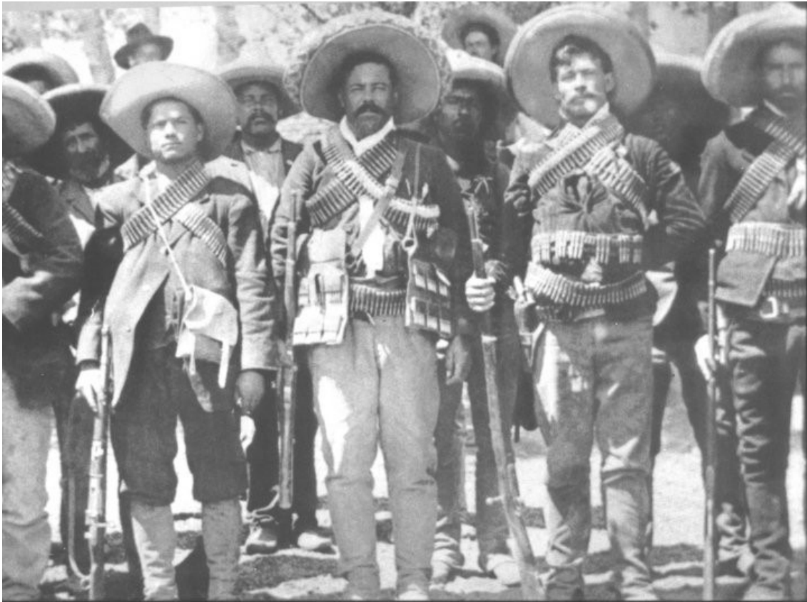
Pancho Villa y sus dorados de la División del Norte