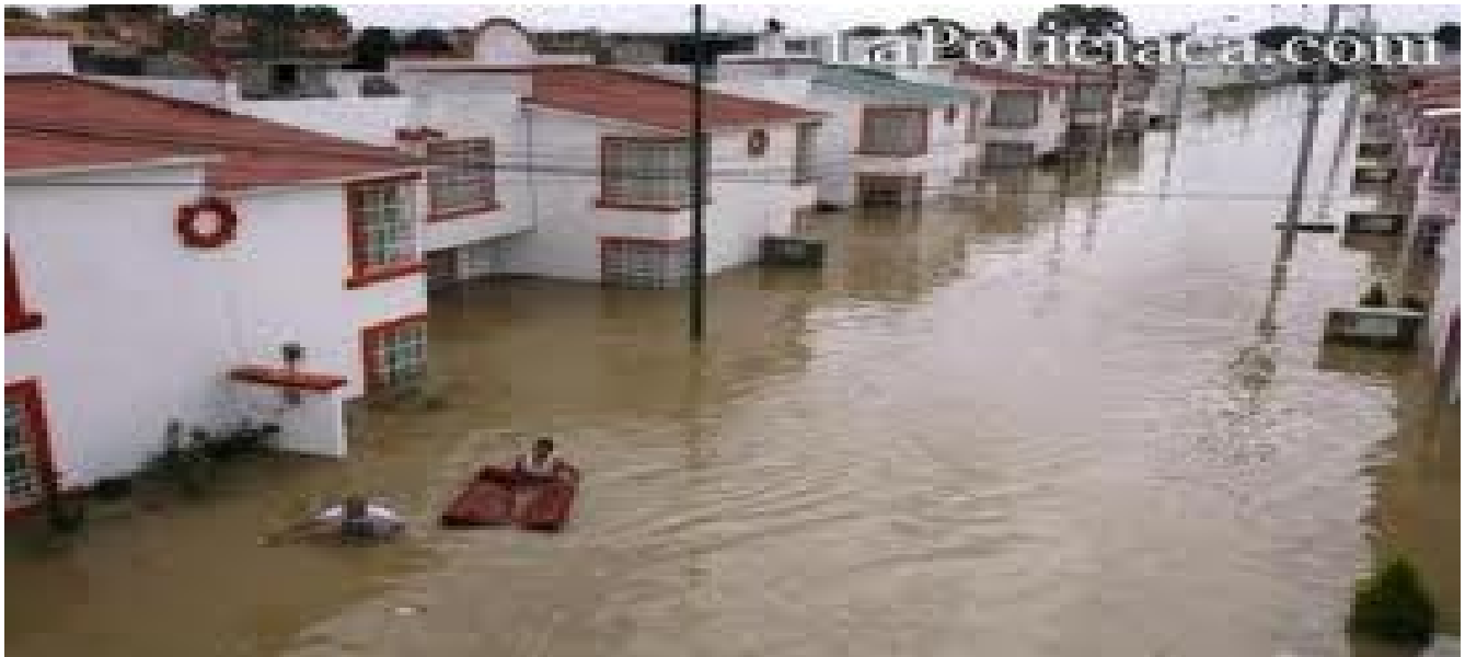
Inundación en el Fraccionamiento Los Olivos, de Cuautitlán, Edomex.