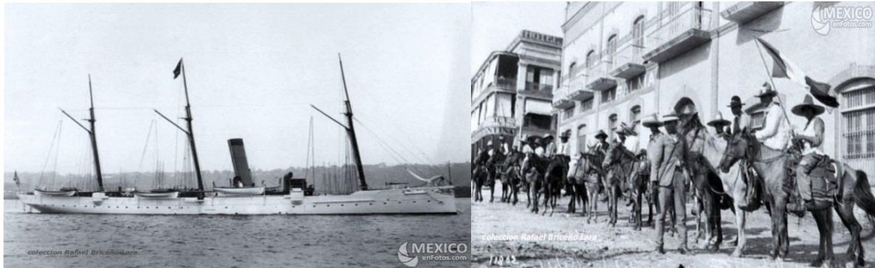
El USS Dolphin, durante la guerra de invasión norteamericana a México (izquierda), y la ocupación en 1914 del puerto de Tampico por los EEUU y revolucionarios en la calle Aldama1910 (derecha)

Los ciudadanos del distrito afectado trataron de realizar un mitin, que no se pudo realizar por la represión ejercida por el Ayuntamiento. No obstante, con todo en contra, los colonos (la mayoría clase trabajadora) notificaron a la Hidros S.A “que si sus conexiones no eran inmediatamente repuestas, graves respuestas se presentarían”. Todavía más; se advirtió a la Compañía, “que si suspendía el suministro de agua o paraban las bombas, los 15 mil ciudadanos tomarían la planta con sus propias manos”.