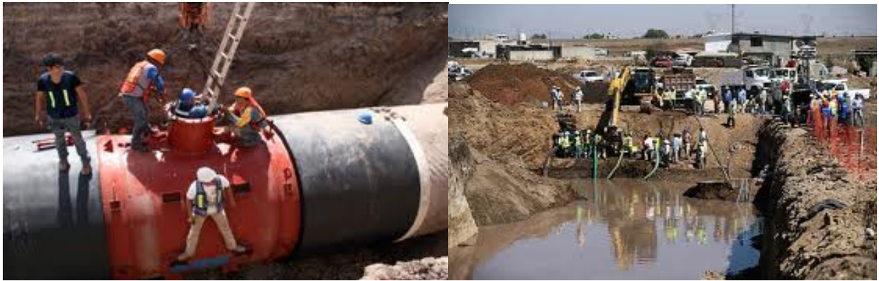
Trabajos de mantenimiento al Sistema Cutzamala