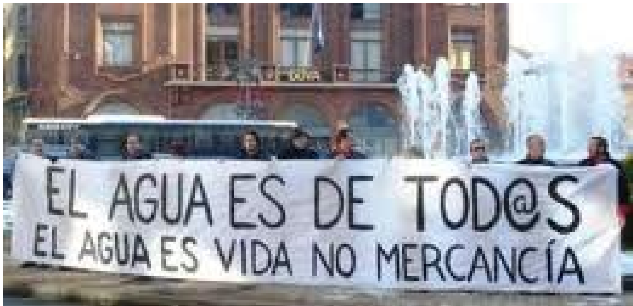
Manifestación en defensa del carácter público del agua