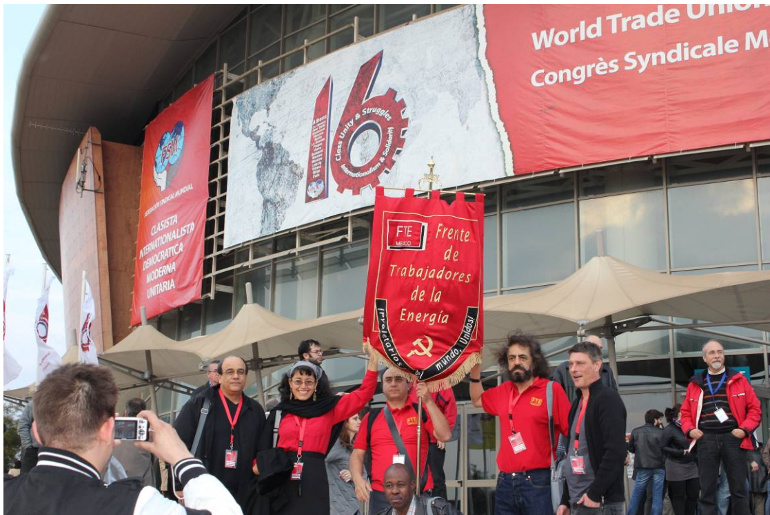
Delegación del FTE de México en el 16° Congreso Sindical Mundial