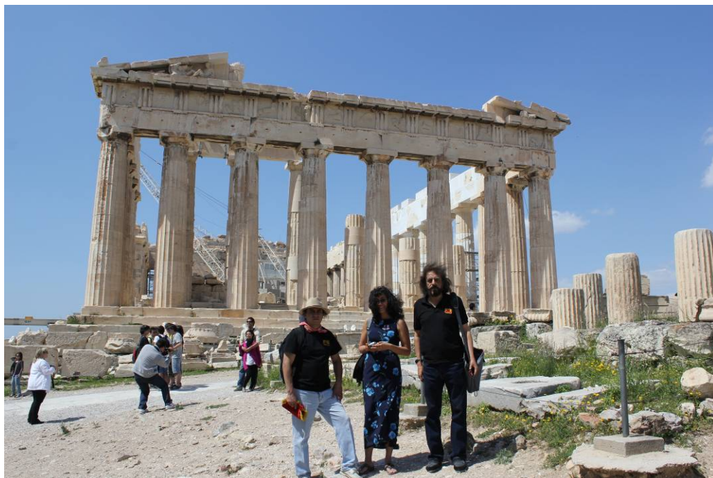
El FTE de México en el sitio de la emblemática cultura griega

Frente de Trabajadores de la Energía, de México