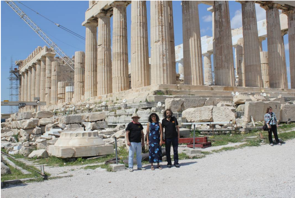
Visita del FTE de México a la Acrópolis de Atenas

2011, energía 11 (186) 58, FTE de México