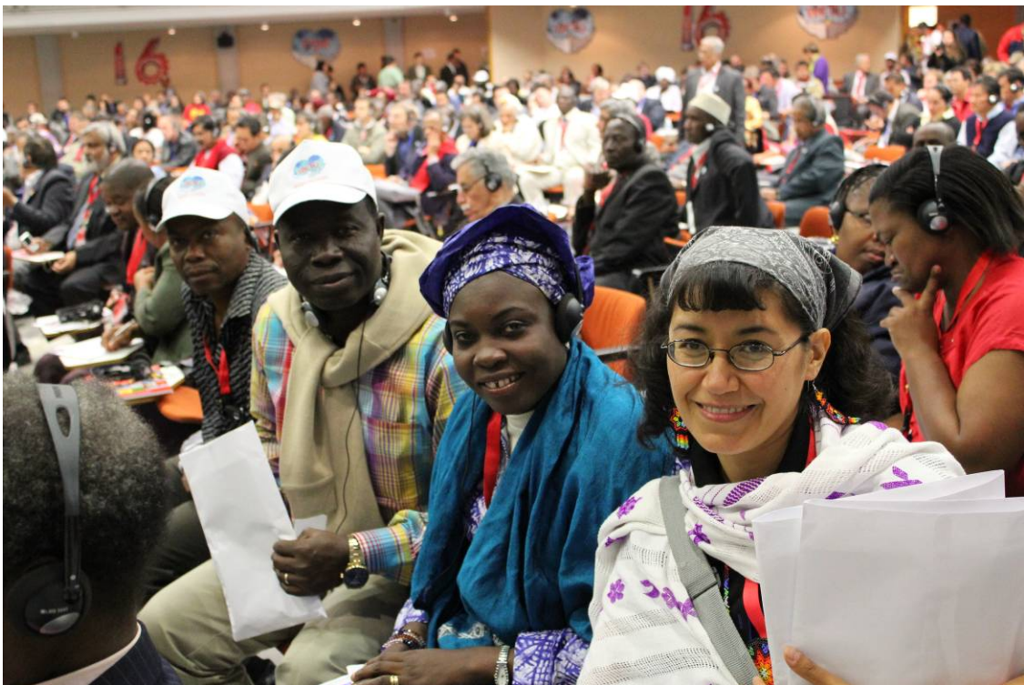
Distribución personal de las propuestas del FTE de México