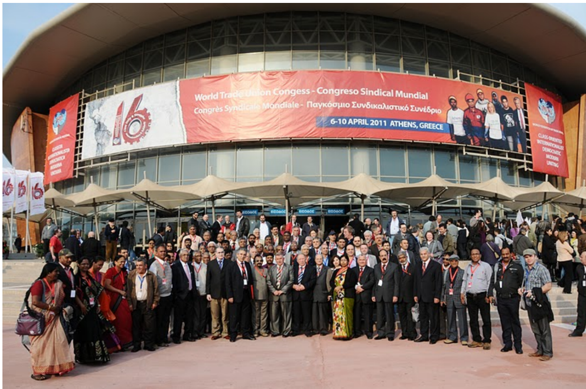
Trabajadores del mundo asistentes al 16° Congreso Sindical Mundial