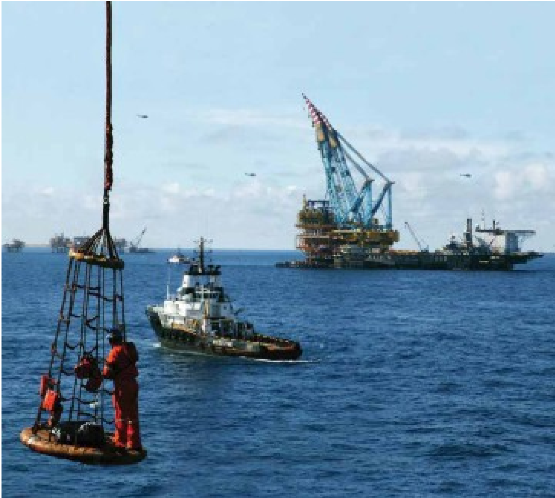
Saqueo de petróleo en las aguas profundas de los mares