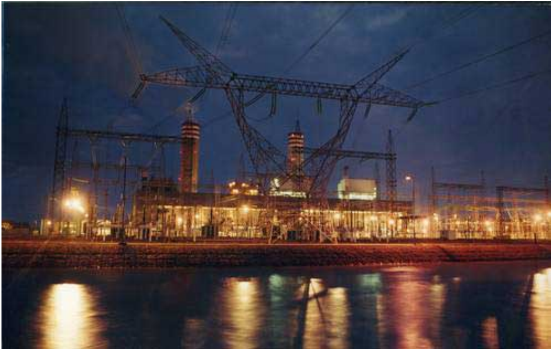
Complejo termoeléctrico de Tuxpan en manos de transnacionales