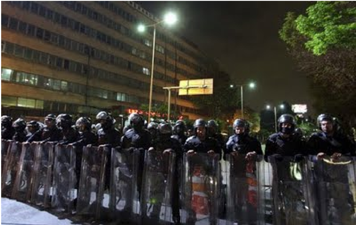
Ocupación policiaca y militar de Luz y Fuerza del Centro el 11 de octubre de 2009. Para el Estado, LFC ya no existe

En el sector eléctrico, la capacidad efectiva instalada ha tenido un crecimiento promedio anual de 3.8% entre 1998 y 2008, con un incremento cada vez mayor de la capacidad instalada privada. En 2009, el margen de reserva del Sistema Interconectado Nacional alcanzó el 47.3%, con un margen de reserva operativo del 20.3%. La “Estrategia” dice que “este elevado margen de reserva es el resultado de niveles de demanda inferiores a lo programado”.