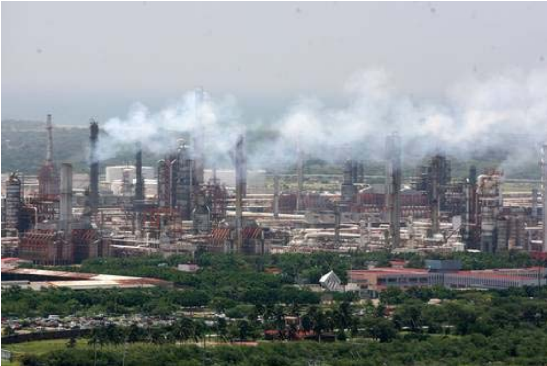
Refinería de Salina Cruz