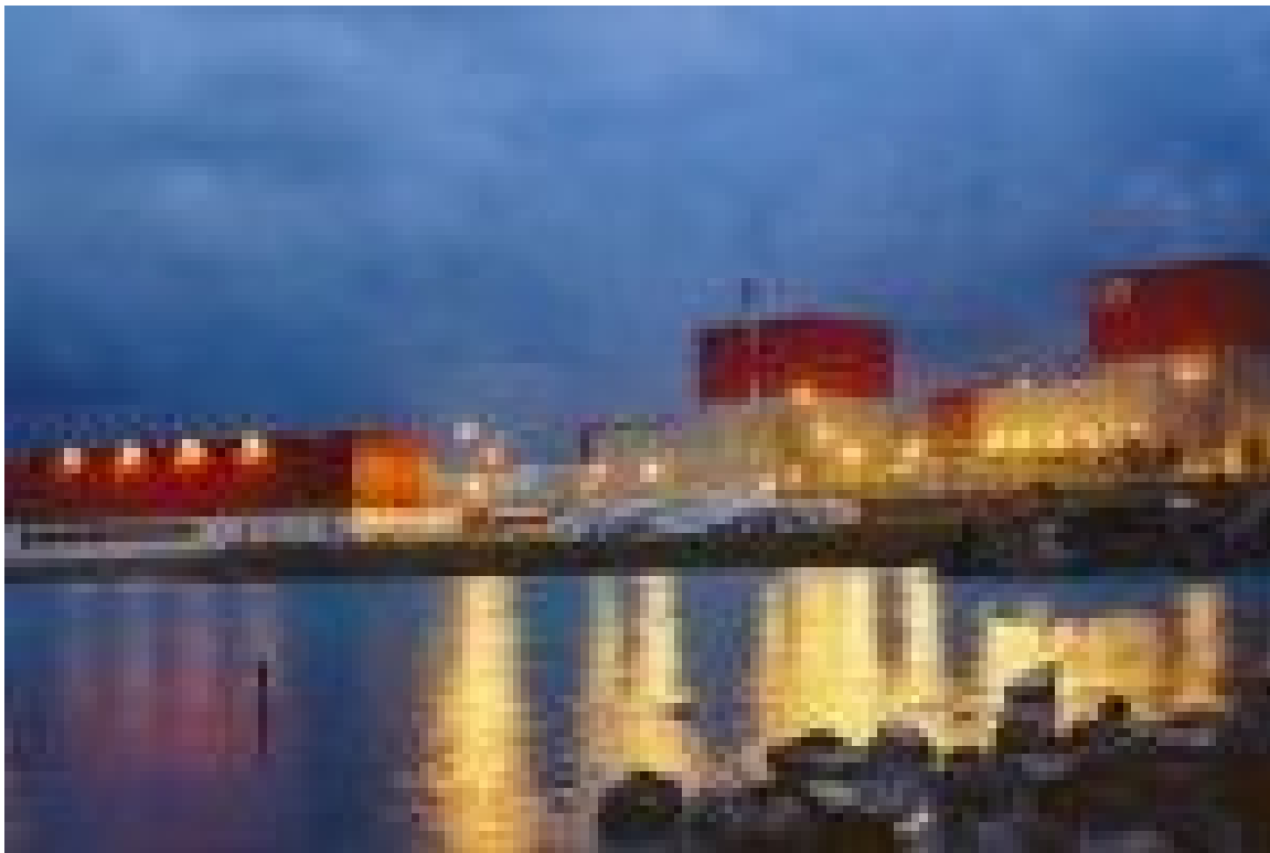
Central nucleoelectrica Laguna Verde