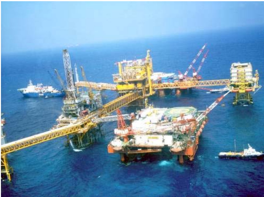
De Ku-Maloob-Zaap se obtiene actualmente la mayor producción de crudo