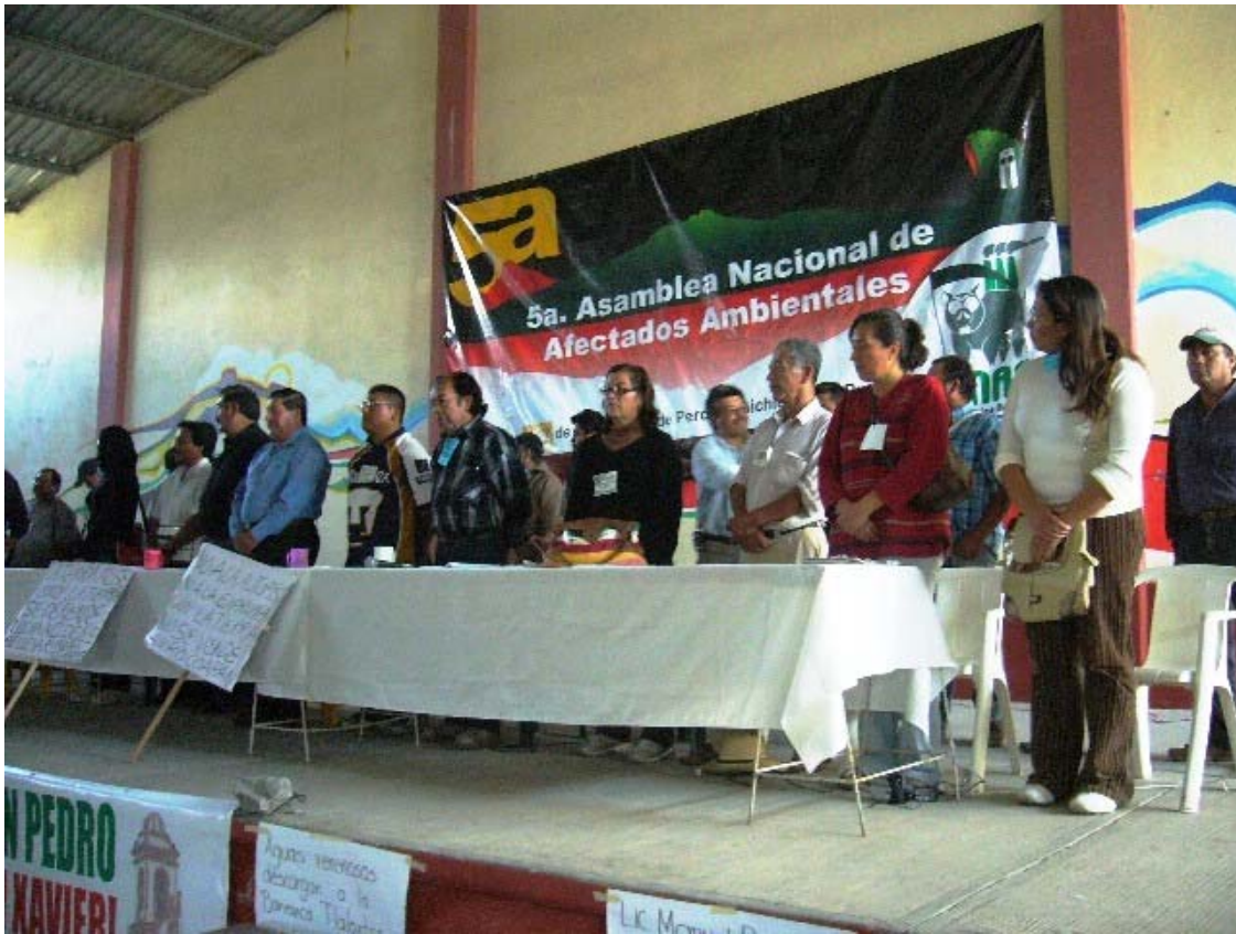
5a. Asamblea Nacional de Afectados Ambientales, Chichicutla, Pue.