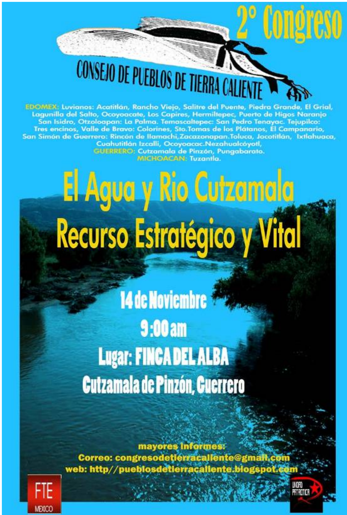
Cartel del 2°. Congreso de Pueblos de Tierra Caliente