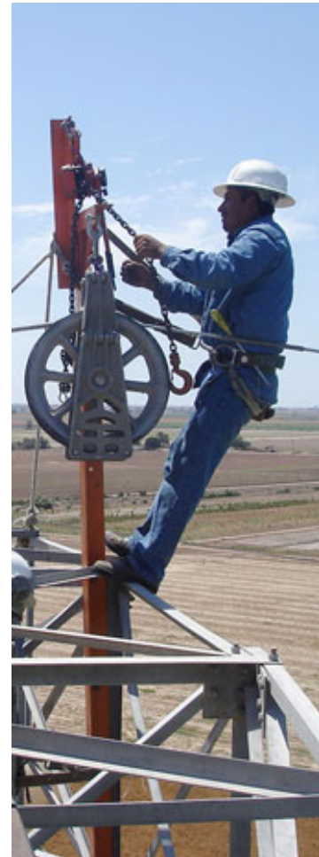
Actividades del proceso de trabajo eléctrico