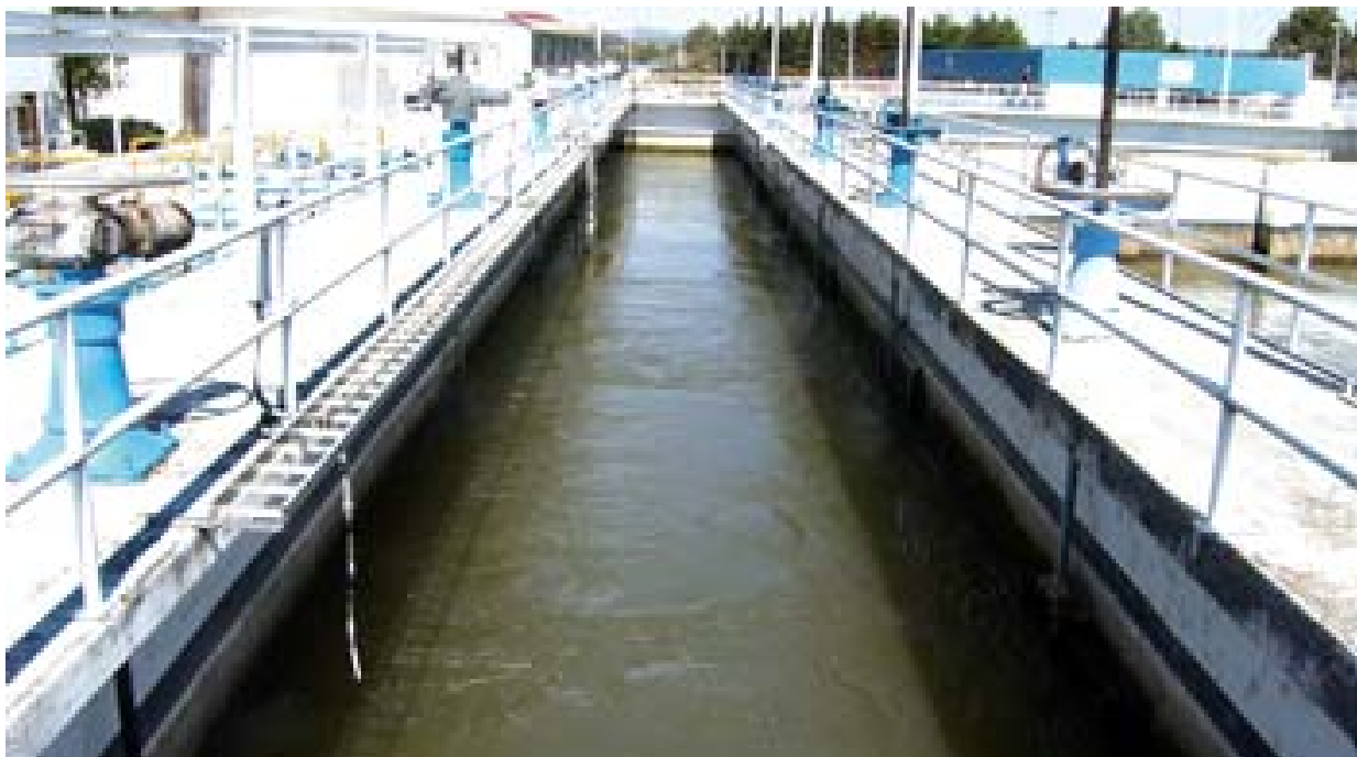
Planta potabilizadora de Berros

[2009, elektron 9 (252) 1-2, 17 oct 2010].