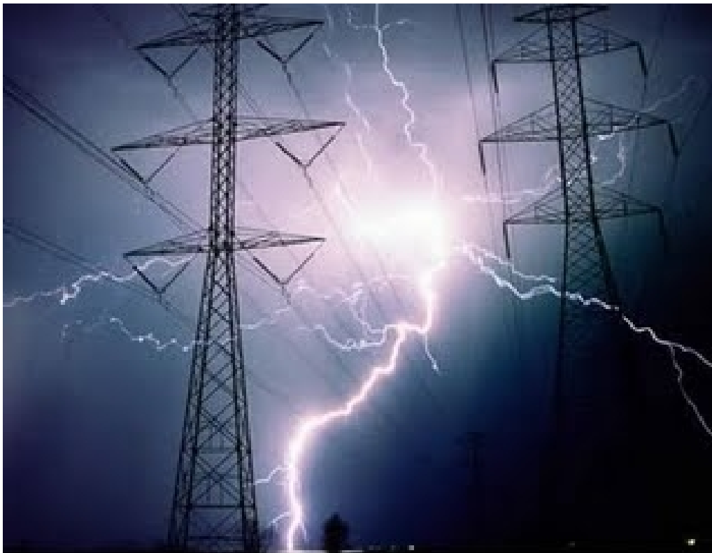
En 2008 hubo intentos de ocupación policíaca y “expropiación” de LFC