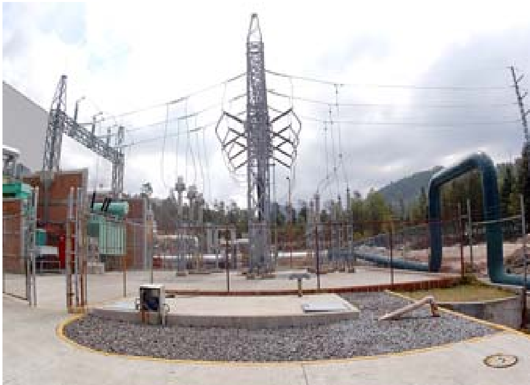
Subestación eléctrica del sistema eléctrico nacional

229 bloques de 933 m 2 ofertados por el gobierno federal en el Golfo de México