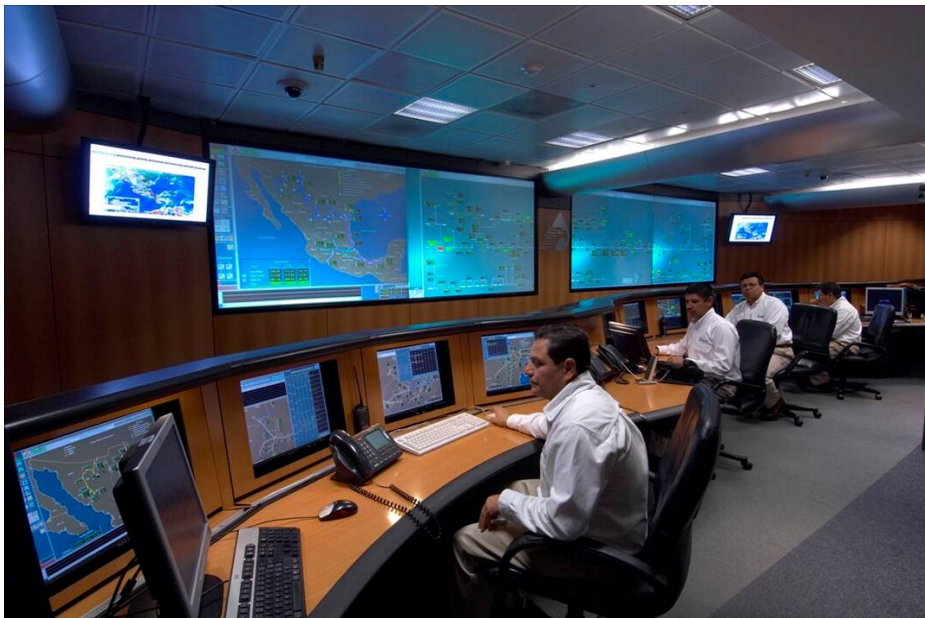
Centro de control Scada para la vigilancia de ductos