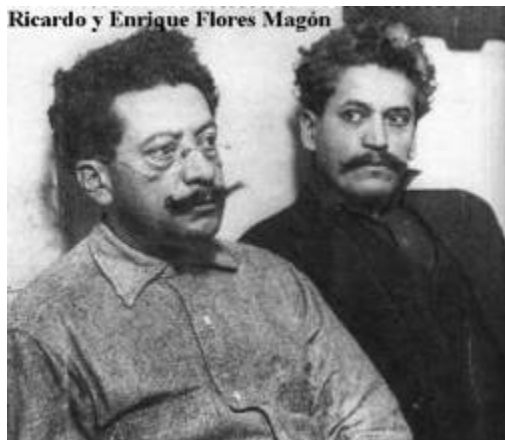
Ricardo y Enrique Flores Magón